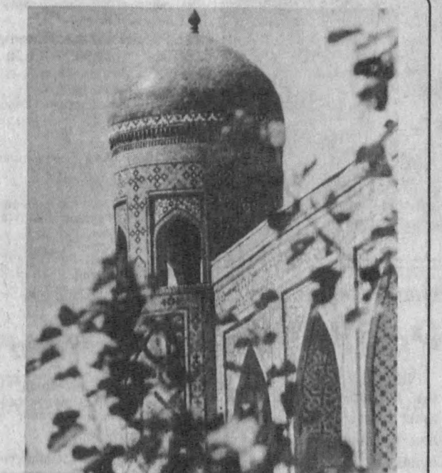
тиб қолган мусиқа деб таърифланган эди. Асрлар мусиқаси Самарқанд гўмбазларида жуда нафис ишланган минораларда, гузал пештоқларда ҳамон янграб турганга ўхшайди... Гузал ва бетакор бинолар қадимий Рим ва Юнониинг Миср ва Хиндистоннинг меъморий ёдгорликлари билан рақобатлаша оладиган санъат намуналари сифатида асрлар оша минг-минглаб сайёҳларнинг зиёратгоҳи бўлиб келмоқда. Зияратчилар уларнинг дил сузларида ҳайратларини изҳор этмоқдалар.

Мен болагиндан Шарқнинг мафтуниман. Қадимий Самарқандни қуришдек орам бор эди. Бу ерда мен ўзбек халқининг гўт бой тарихига эга эканлигига яна бир қарра амин бўлдим. Самарқанднинг ноб тарихий ёдгорликлари, айниқса Гўри Амир мак-