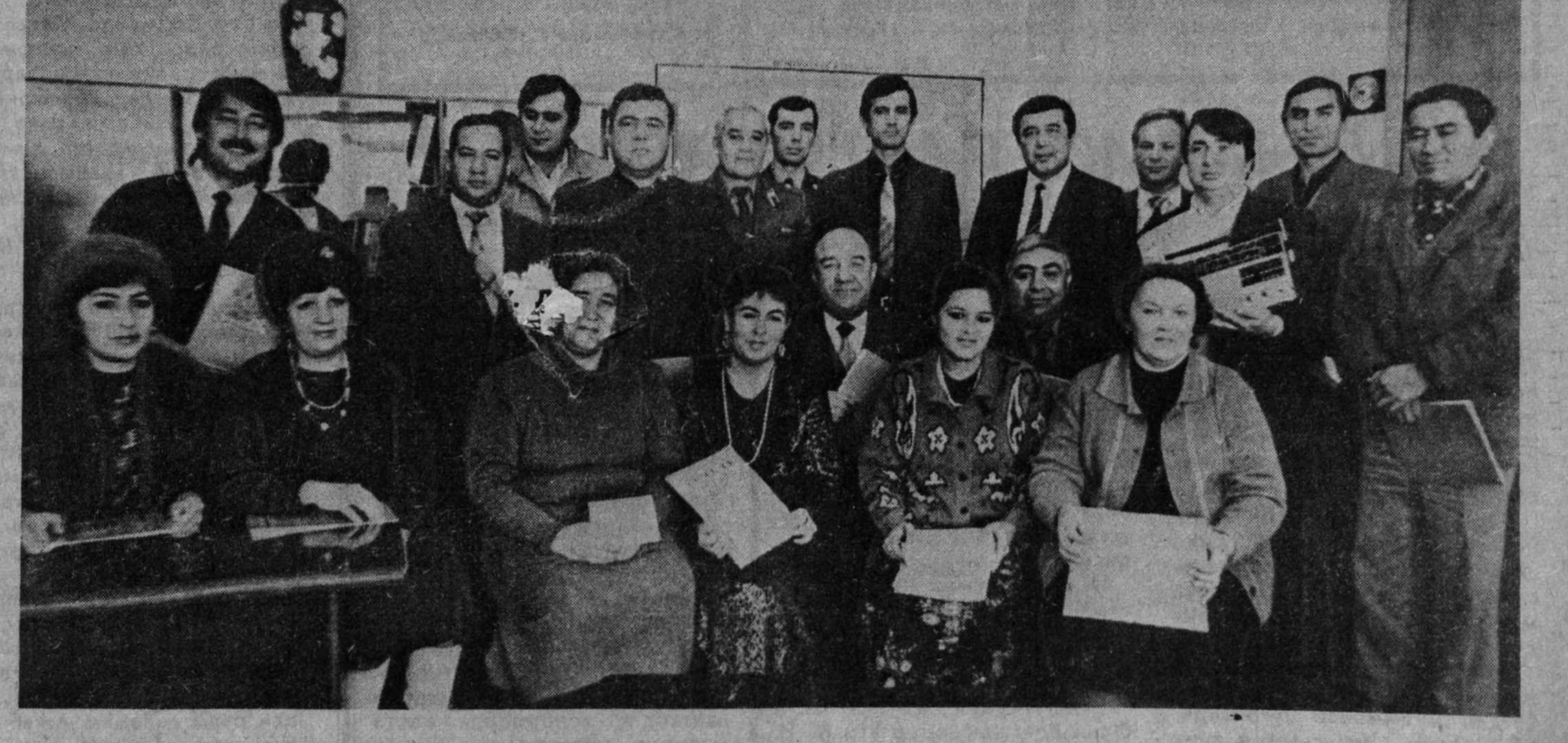
Суратда: Обуна якунлари голиблари.