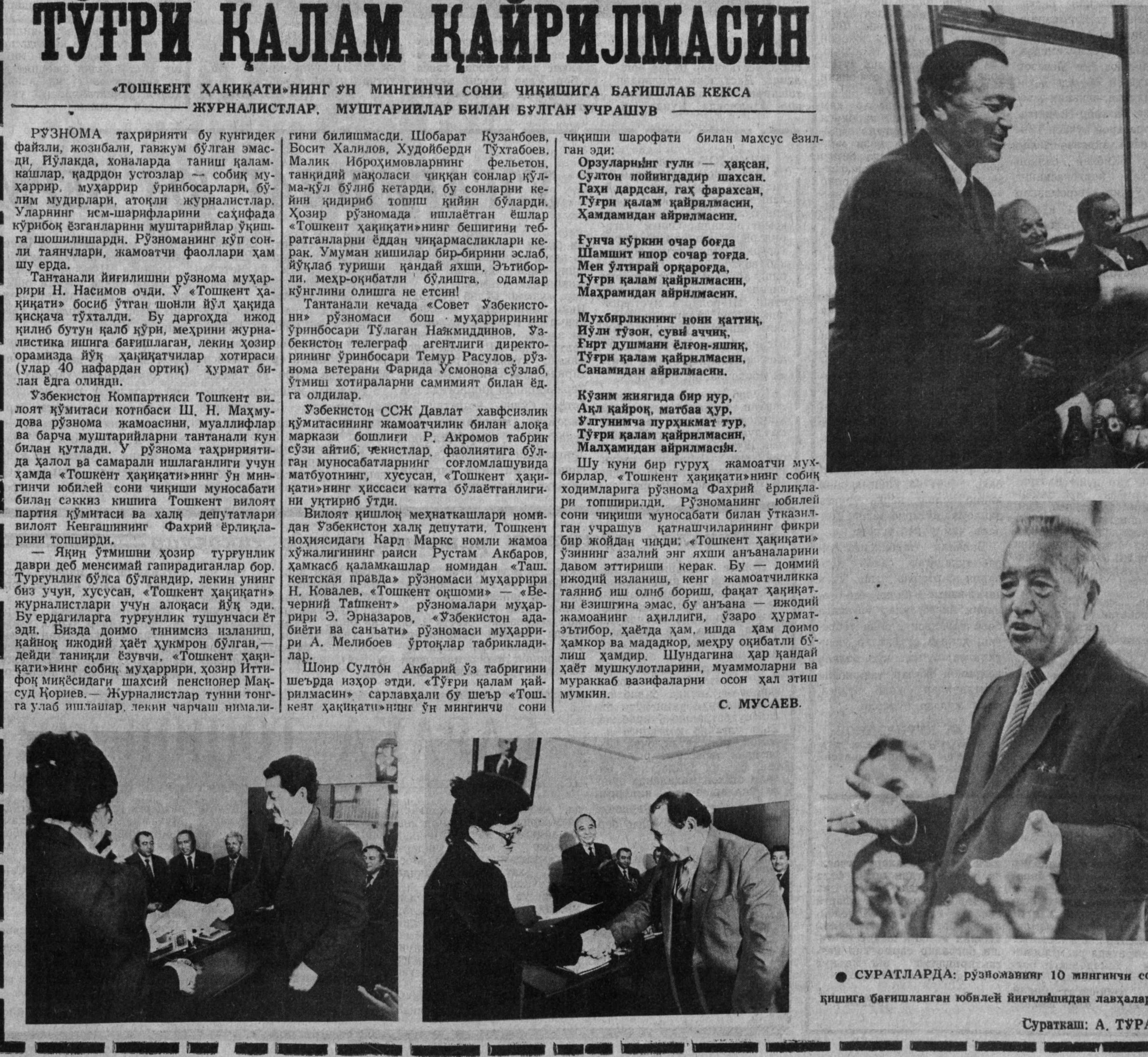
Суратларда: рўзноманинг 10 мингичи сон чiqишига бағишланган юбилей йиғилишидан лавҳалар.