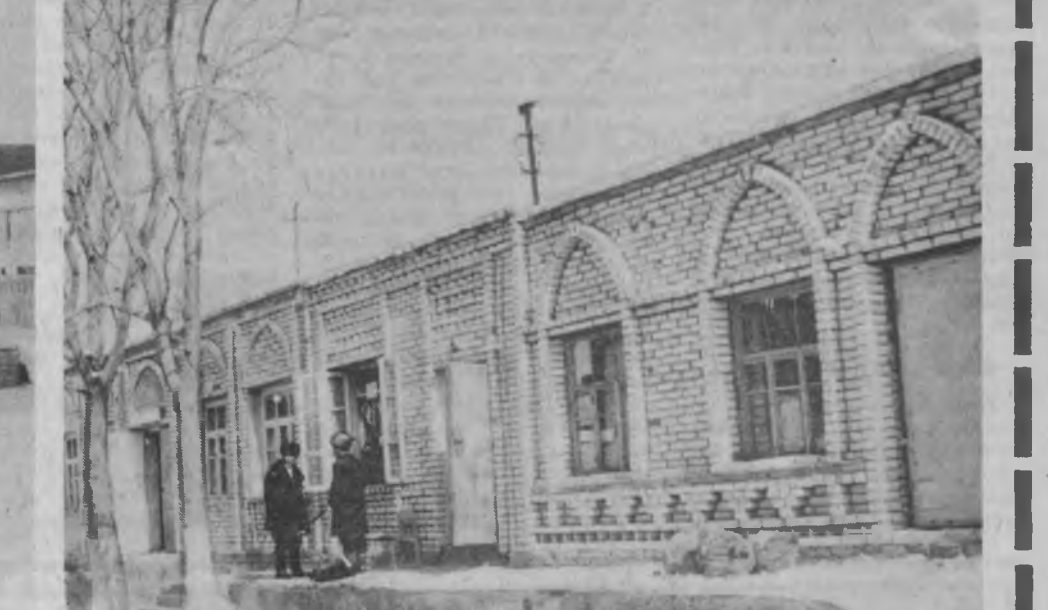
СУРАТЛАРДА: Пискентда урғутликлар тажрибаси асосида қад кўтарган қурилишлар.