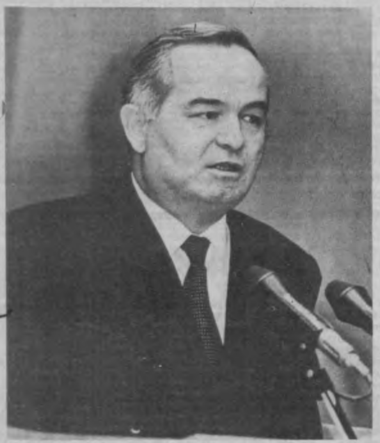
СУРАТДА: учрашув пайти.

1928 йил 11 декабрдан нашр этилмоқда. Вилоят ижтимоий-сиёсий газетаси ЧОРШАНБА ВА ШАМБА КУНЛАРИ ЧИҚАДИ.