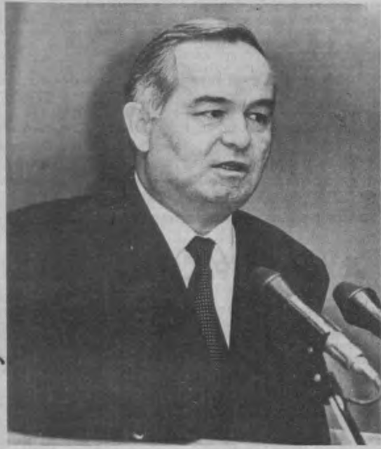
СУРАТДА: утрасуви пайти.