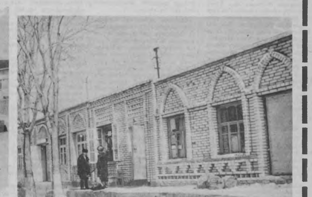
СУРАТЛАРДА: Пискентда ургутликлар тажрибаси асосида қад кўтарган қурилмалар.