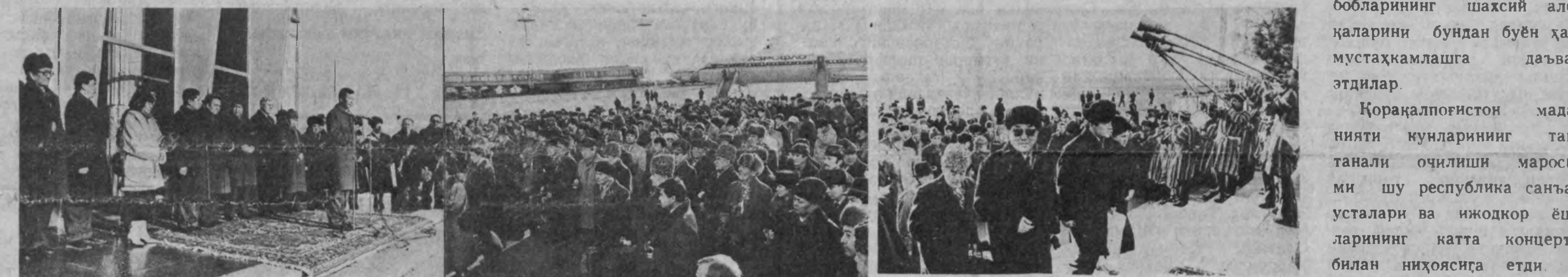
СУРАТЛАРДА: Қорақалпоғистонлик аэз меҳмонларини кутиб олиш пайти.