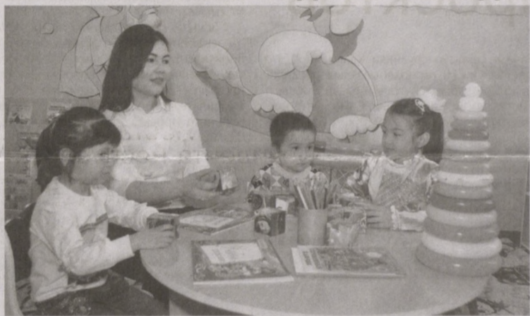
В махалле "Учтепа" Шафара-Рашидовского района Джизакской области сыана в эксплуатацию дошкольная образовательная организация "Kids-kids" на 150 мест, возведенная за счет льготного кредита, выделенного банком.

В учреждении, созданном на основе государственно-частного партнерства, специализируемся на изучении русского, английского и корейского языков, воспитываются сто детей в шести группах. К группам прикреплены квалифицированные воспитатели, а также два помощника.