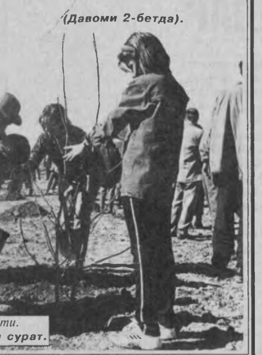
СУРАТДА: кўчат утқазиб пайти.

ҳокими Умнат Мирзақулов хорижий меҳмонларни кутлар экан. — Олис ва яқин қўшни давлатлар элчиларининг ўзларидан кўркам боғни эсдалик қилиб қолдиришга жазм этганлари ҳам рамзий маънога эгадир.