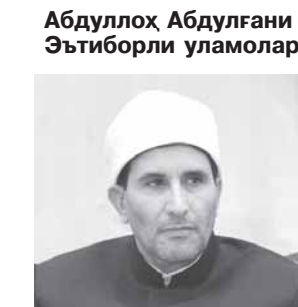
— Имом Абу Мансур Мотуридий асос солган мотуридия таълимоти

халқ манфаатлари йўлида улкан ислохотларни амалга ошираётган Ўзбекистон Республикаси Президенти Шавкат Мирзиёевга алоҳида миннатдорлик билдирдилар.