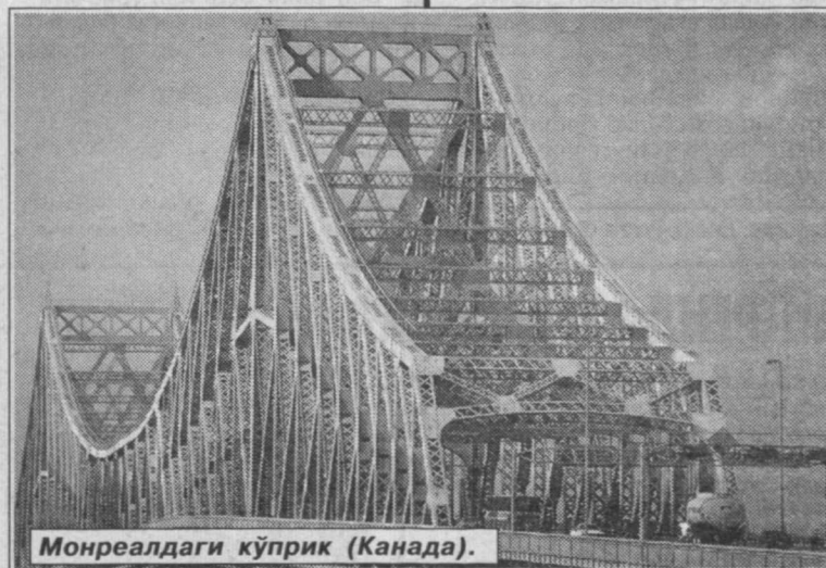
Монреалдаги кўприк (Канада).

Нью-Йорк музокараси кейинроқ бевосита оролга кўчирилади. Мақсад 31 мартда икки жамоа ўртасида Кипр ороли муаммоларини ҳал этиш бўйича битимни имзолаш. Унга кўра, оролда икки жамоали ва икки ҳудудли давлат тузилади. Ушбу битимни ва жорий йилда Кипрнинг Европа Иттифоқига аъзо бўлишини маъқуллаш учун оролнинг икки қисмида ҳам референдум бўлиб ўтиши керак.