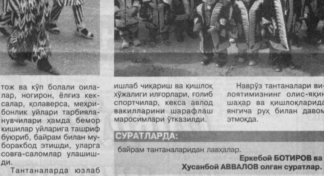
Наврўз тантаналари вилоятимизнинг олис-яқин шаҳар ва қишлоқларида янги-янги байрам давом этмоқда.

лари субҳидамдан тўкин дастурхон атрафига тақлиф қилиндилар. Дошқозонларда дамланган ош, сумалағу халимлар, қўлам ноз-неъматлари дастурхонга тортилди. Кексалар оқ фотиҳаси олинган, ҳамма жойда Наврўз сайли, шўх-шодон тантаналар бошланиб кетди. Бадий