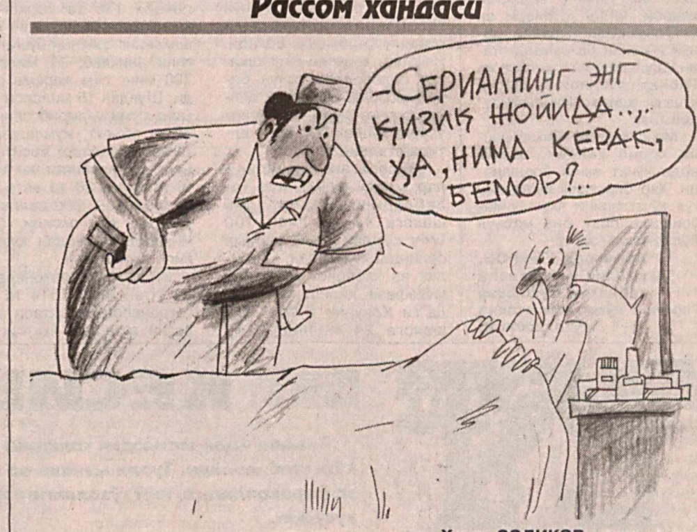
Хусан СОДИКОВ чизган расм.