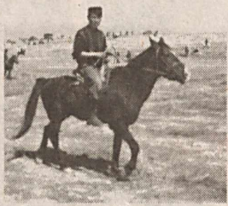
каби шаҳди йўқ инсоннинг ҳам ўз орзусига етиши мумкин.

Йўловчи отга кетма-кет қамчи уриб, манзил сари кистарди. Жони озор чекаётган от эса, аравани елдек учуриб, чопарди. Ха, керакли юкни манзилга тез етказиш учун оту аравадан ташқари қамчи ҳам зарур.