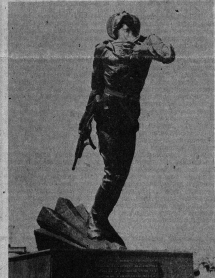
ЧИРЧИҚ ШАҲРИДА БАЙНАЛМИЛАЛ ЖАНГИЛАРГА ЕДГОРЛИК ЎРНАТИЛДИ