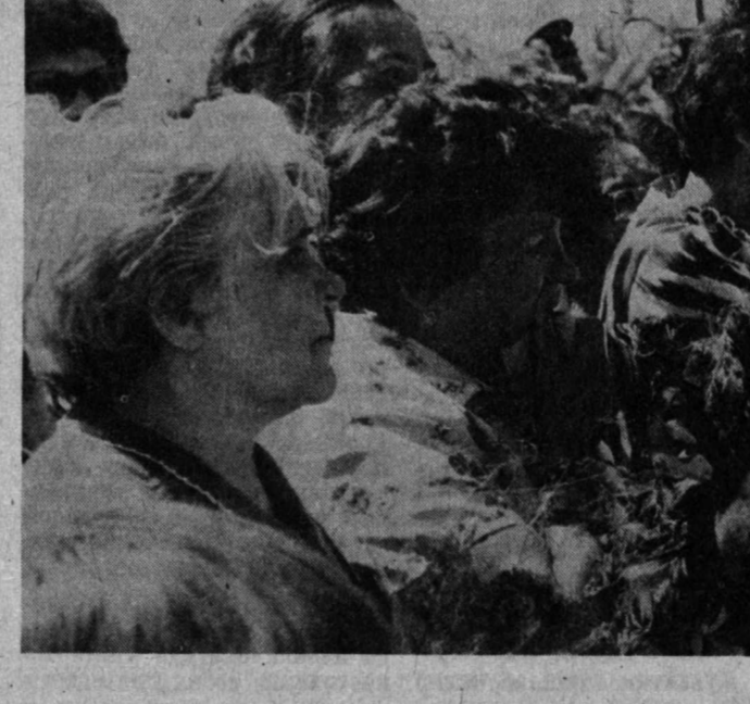
СУРАТЛАРДА: ёдгорликнинг очилиш маросимидан лавҳалар. Муаллиф сурагларни.

Тошкент вилоят партия комитети бюросининг мажлиси бўлди. Мажлисида «Ўзбекистон Компартияси Марказий Комитети бюросининг партия сафарини мустақамлаш тўғрисидаги 1990 йил 21 ноябрдаги қарорини бағраиш бюросида Ангреп, Олмалик, Бемобод шахар партия комитетларининг иши тўғрисидаги масала муҳокама қилинди. Ангреп, Олмалик, Бемобод шахарлари партия комитетлари, бошланғич партия ташкилотлари партия сафарини мустақамлаш, коммунистларнинг жамиятда юз бераётган мураккаб сўсий ва иқтисодий жараёнларга таъсирини кучайтириш юзасидан ўз иш усул, шакл ва усулларини янгиллашга интилаётганликларни таъкидланди. Улар иқтисодий ислохотни фаол ўтказиш учун раҳбар коммунистлар масъулиятини кучайтириш, тағйирлик қарши тадбирларни амалга ошириш, мехнатташларни ижтимоий ҳимоялаш муаммоларини ҳал этишда ташаббус қўришнинг бўйича қўришга тадбирларни қўриди-лар. Бироқ олиб борилаётган иш савияси шахарларда тўпланиб қолган кескин муаммоларга тўла жавоб бермайдди. Шаҳар партия ташкилотларида назарий ишнинг ахамияти сусайтириб қўйилган, бу ҳол улар фаолиятининг сифатига сезиларли таъсир қилмоқда.