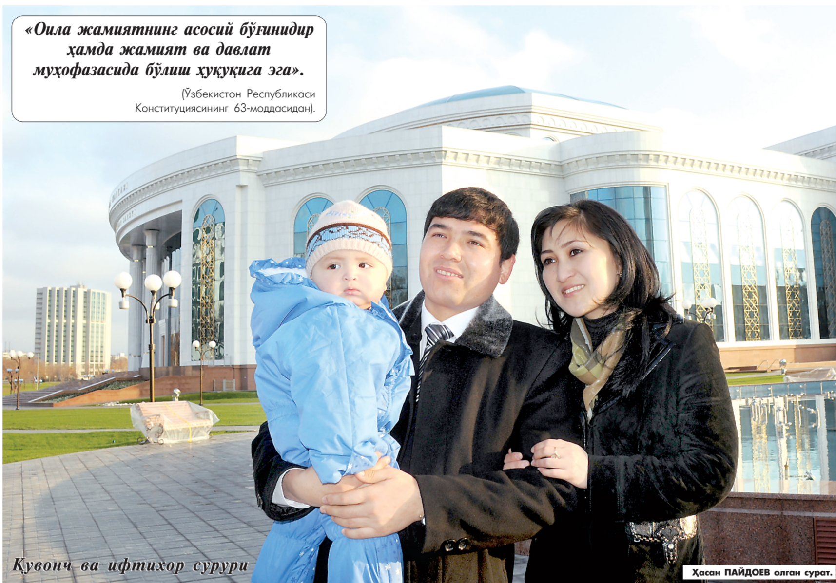
Кувонч ва ифтихор сурури

(Ўзбекистон Республикаси Конституциясининг 63-моддасидан).