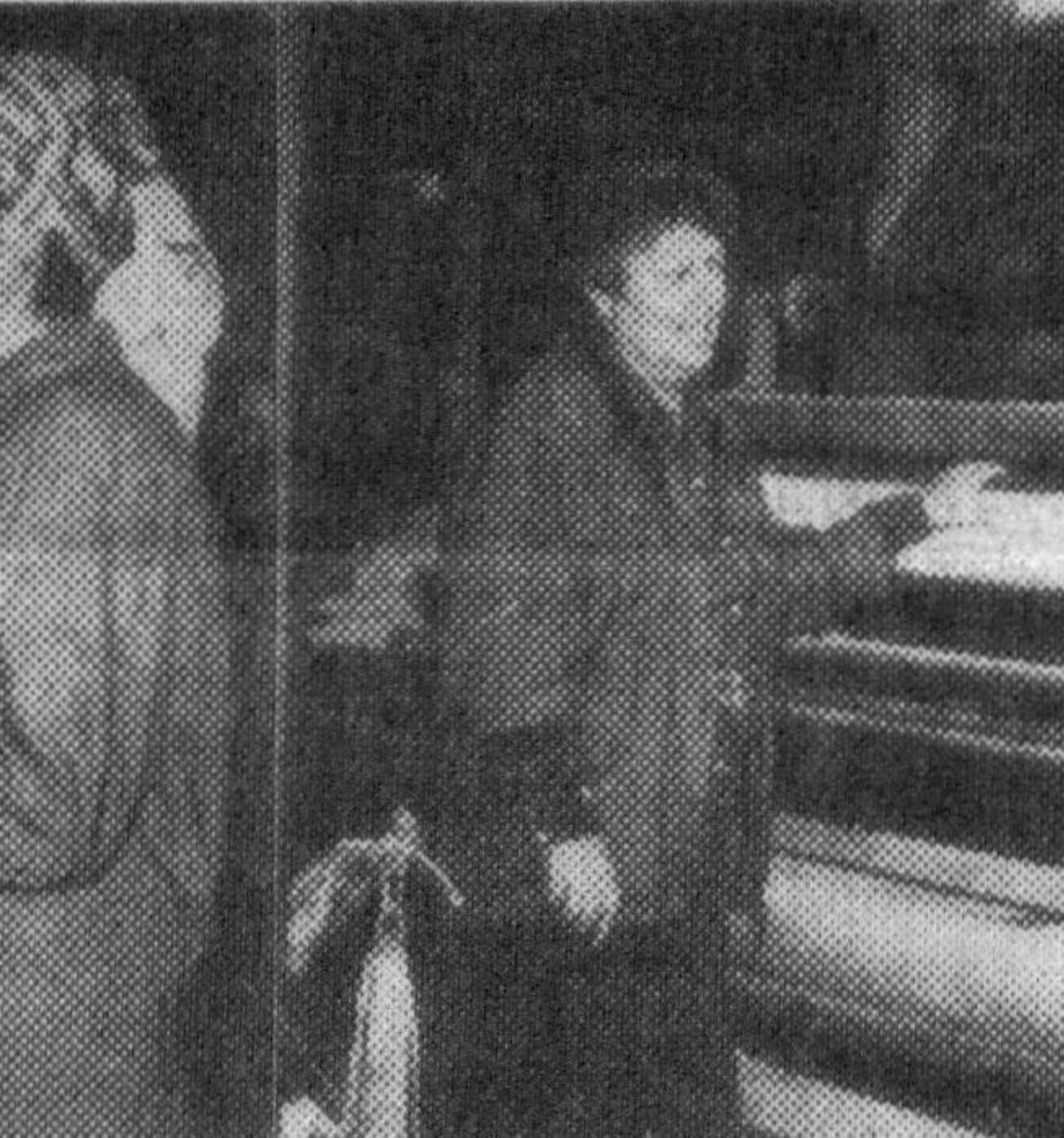
Суратларда: «Қурилиш пластмасса» акционерлик жамияти ишчилари ўзлари тайёрлаётган янги махсулотлар билан.