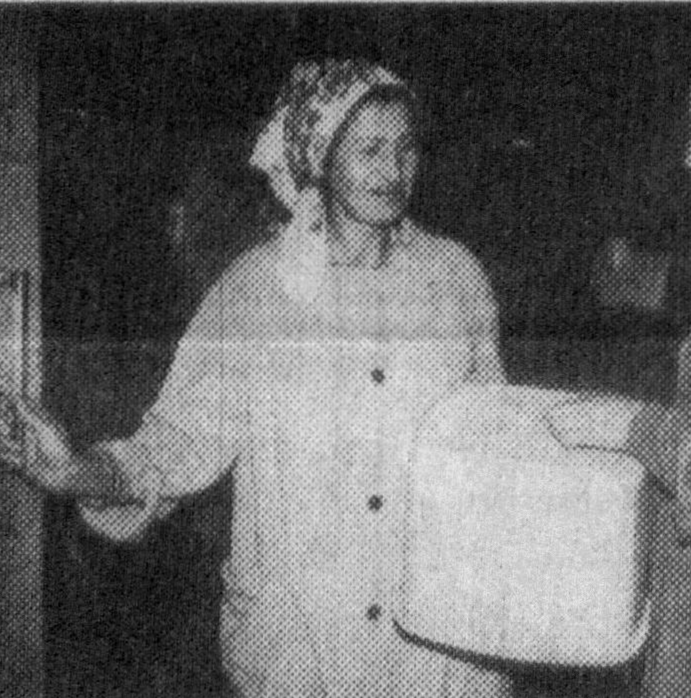
Бежирим ва сифатли ленолеум девари ҳар бир хонадон учун керакли ва зарур ашёдир. Ҳисдорлик жамияти аҳолини бу ашё билан етарли даражада таъминлаш учун бор кучини сарфламақда. Корхонада ҳамашё тақчиллиги ҳал этилган, бошқа турли бўюмлар ишлаб чиқариш ҳам йўлга қўйила бошланди. Бундай бўюмлар сони яқинда 40 тагача етди.