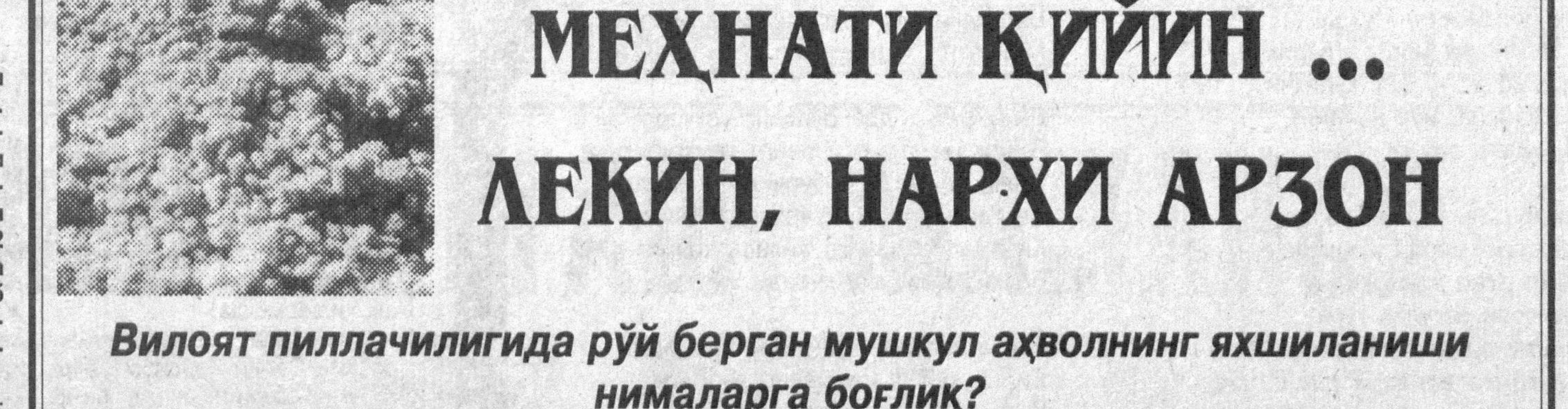
Вилоят пиллачилигида рўй берган мушкул аҳолниң яхшиланиши нималарга боғлиқ?