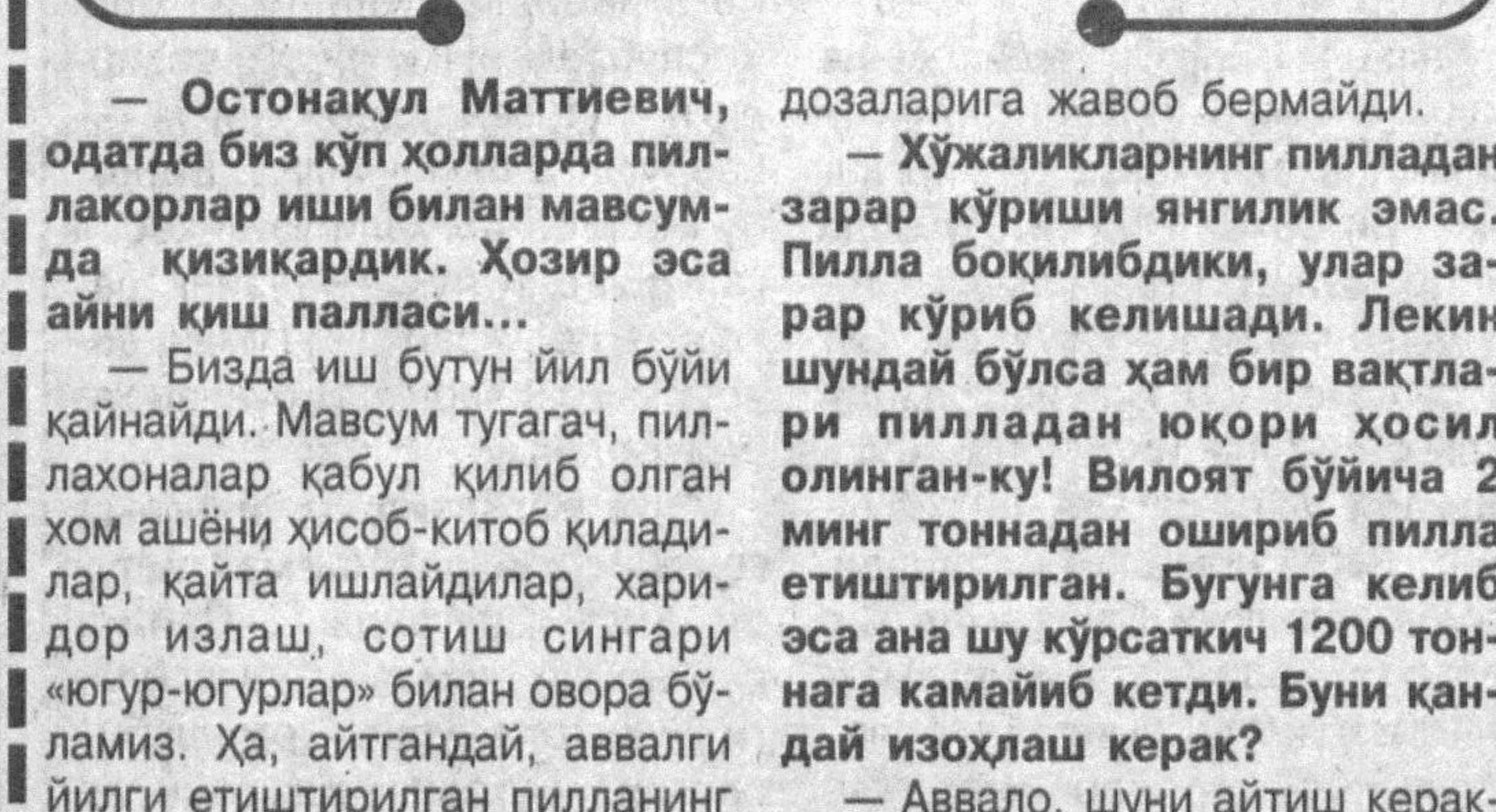
Вилоят пиллачилигида рўй берган мушкул аҳолниң яхшиланиши нималарга боғлиқ?