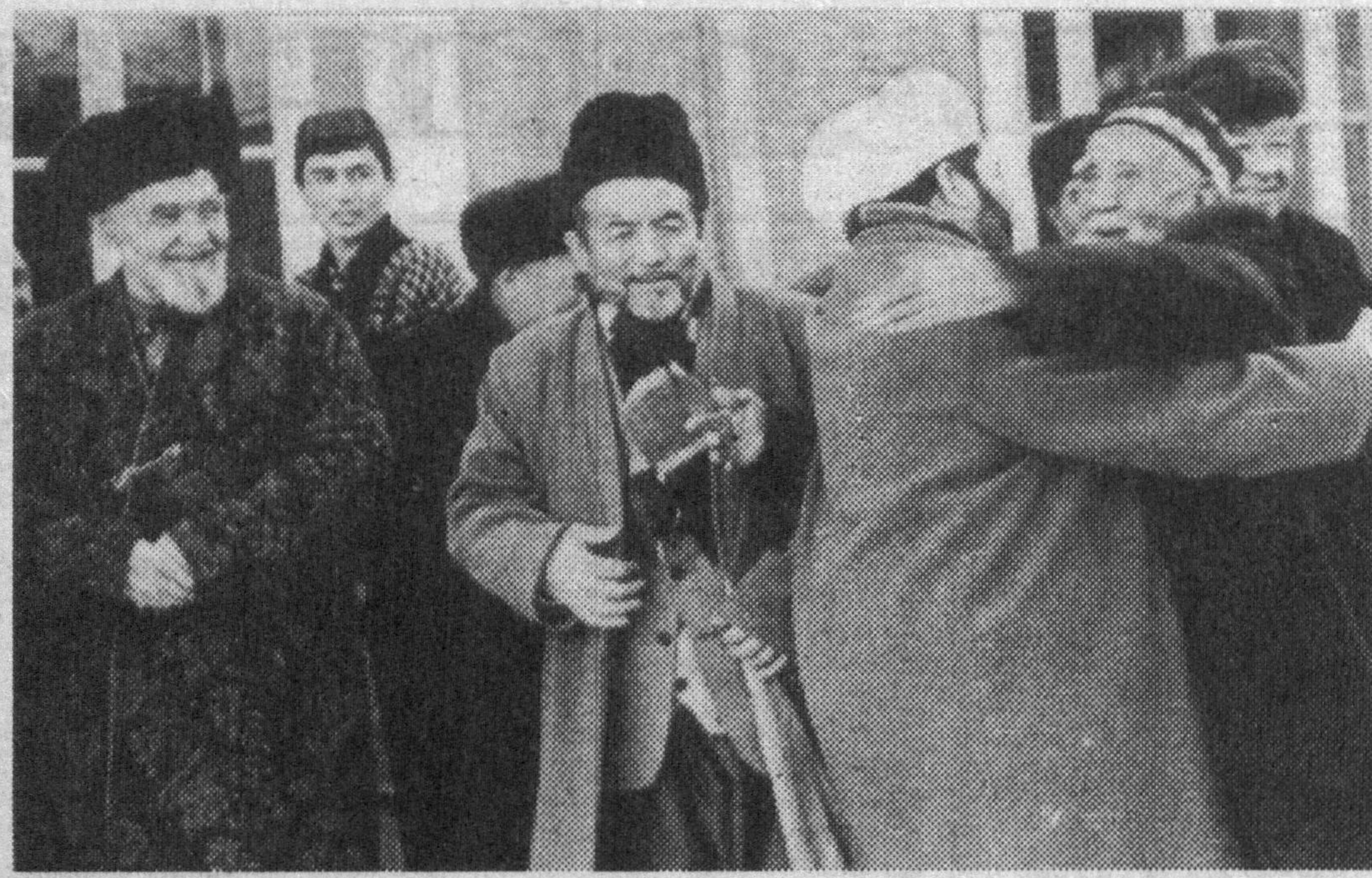
—Айёмингиз муборақ бўлсин!