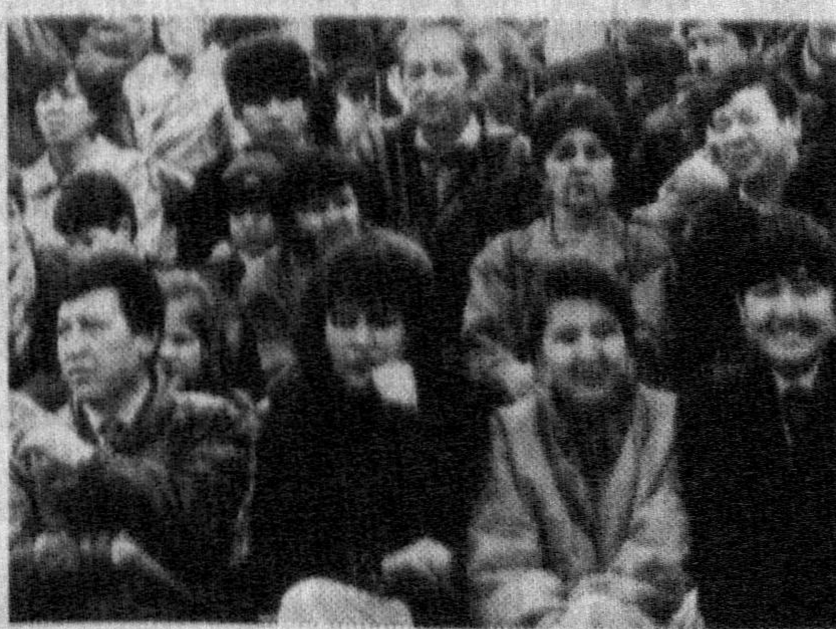
Вилоятнинг Наврўз тантанасидан лавҳалар.

ўзига тегишли «ҳовли»ни безашда, дастурхон ёзишда гўё бир-бири билан мусобақалашаётгандек эди. Утовлар чиройли қилиб безатилди. Сўриларга гиламлар тўшалди, Баҳор нознеъматлари — сумалак, ҳалим, сомса, чучваралар дастурхонни безадди.