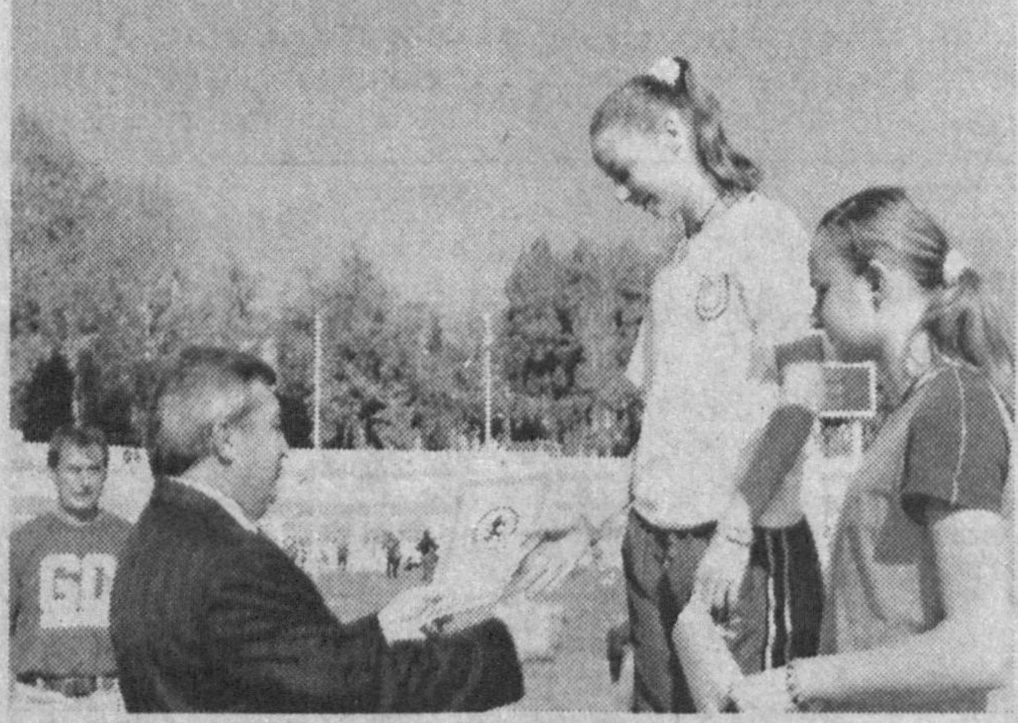
СУРАТЛАРДА: мусобақа жараёни ва тақдирлаш пайти.