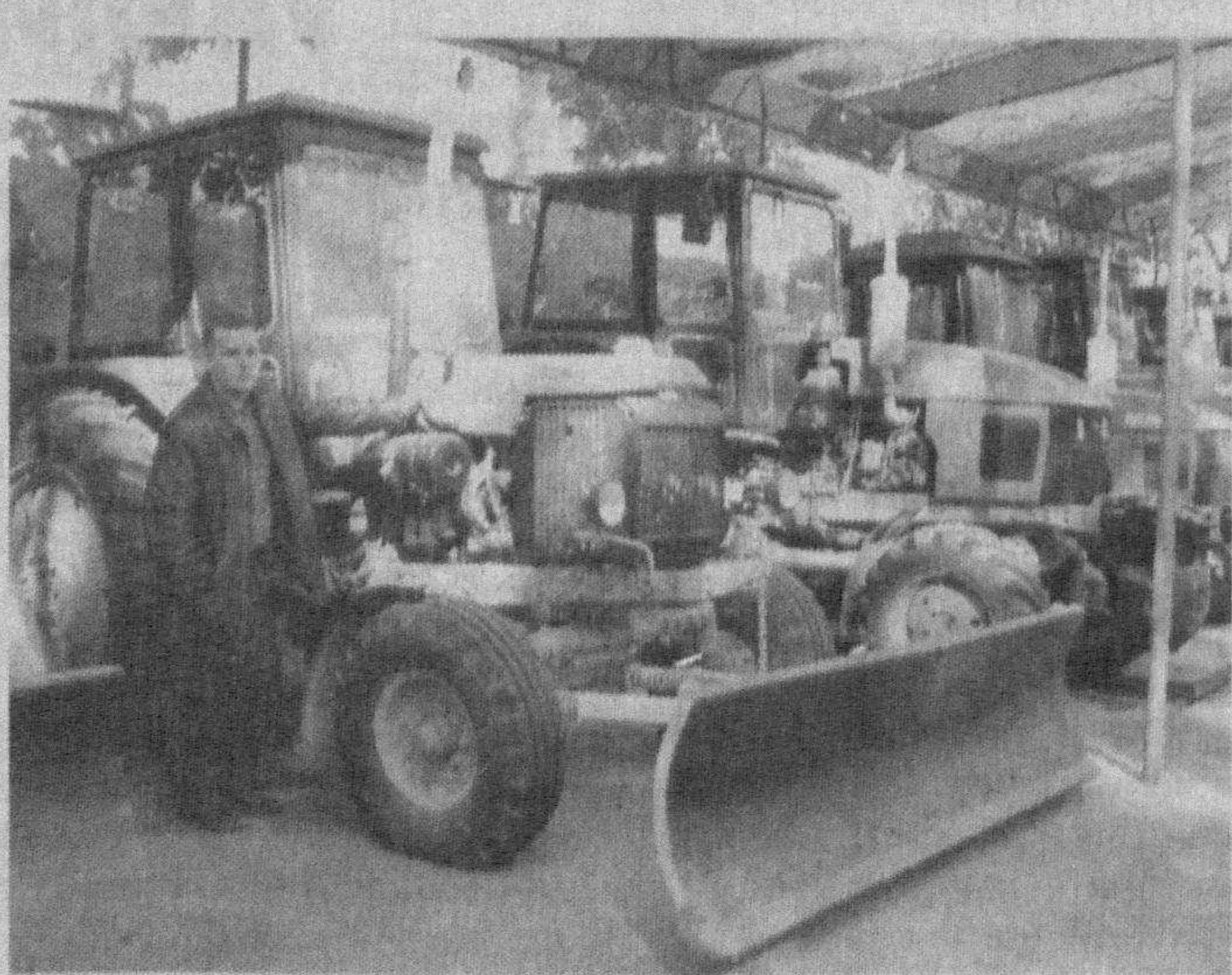
введения различных агротехнических мероприятий.

Как сообщили в компании, важную роль в обеспечении села техникой призваны сыграть и технические центры, созданные при холдинге. Они реализовали в минувшем году различную сельскохозяйственную технику и запасных частей почти на 6,4 млрд. сумов. Значение этих центров возрастает в связи с реорганизацией ширкатных хозяйств в фермерские — теперь на них возлагаются и функции по оказанию услуг фермерам для про-