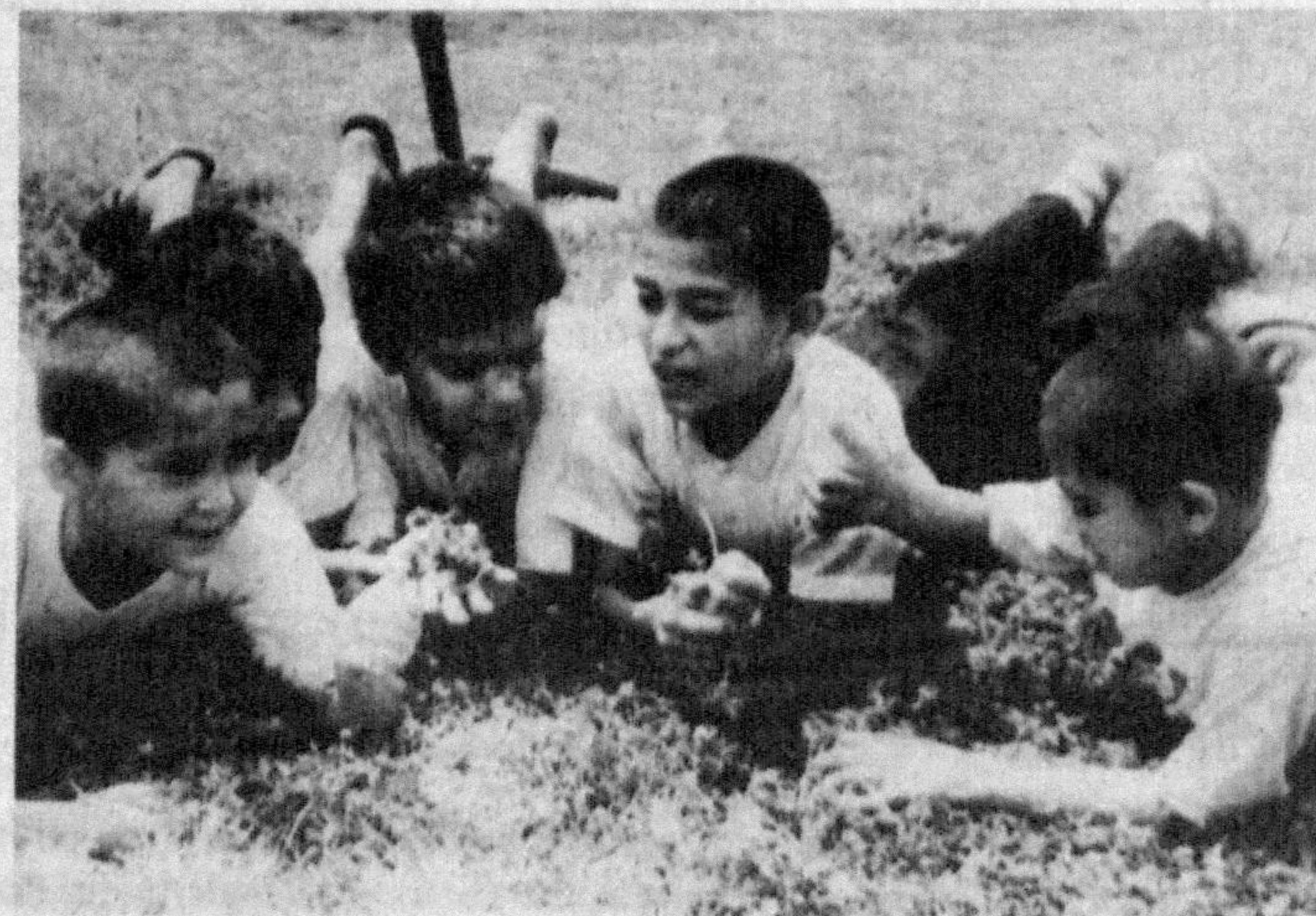
БИР БОР ЭКАН, БИР ЙЎҚ ЭКАН...