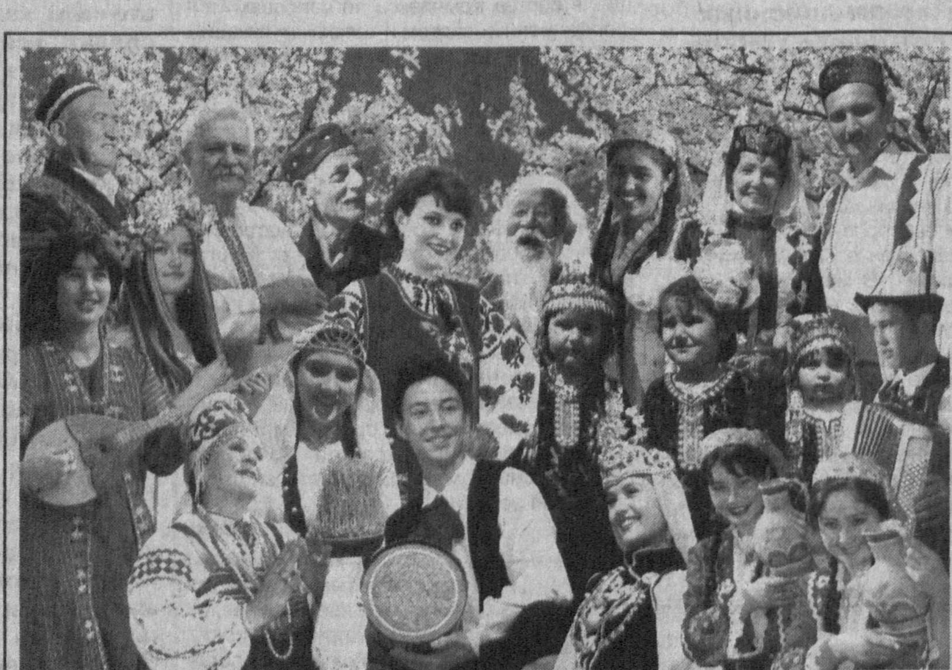
В Узбекистане в дружбе и согласии живут более 130 национальностей.

В центре внимания участников заседания были актуальные задачи по усилению сотрудничества культурных цент-