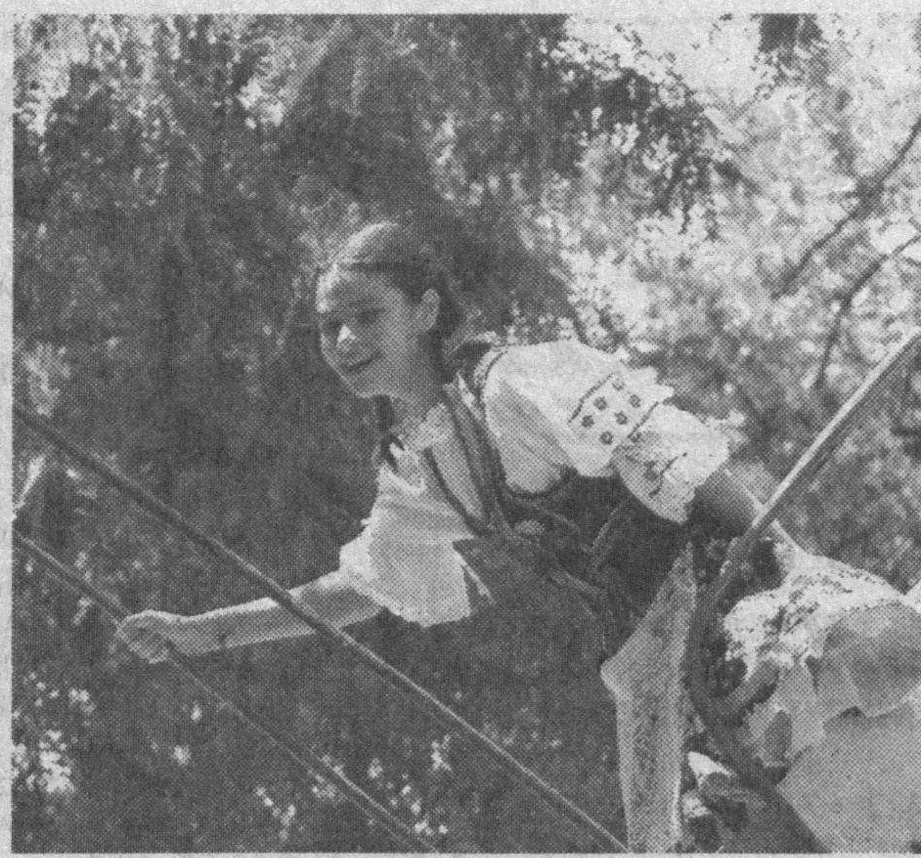
Нашим детям необходимо развивать, совершенствовать способности, данные от природы. От нашего воспитания и поддержки зависит, какой именно талант проснется в маленьком человеке.