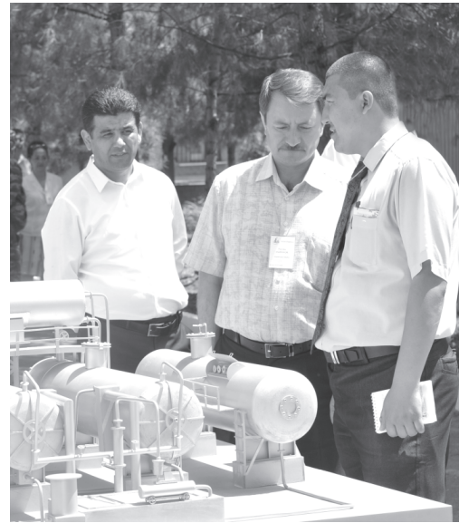
Фото Ш. Шеропово.

В завершение визита участники встречи, воспользовавшись представленной возмож-