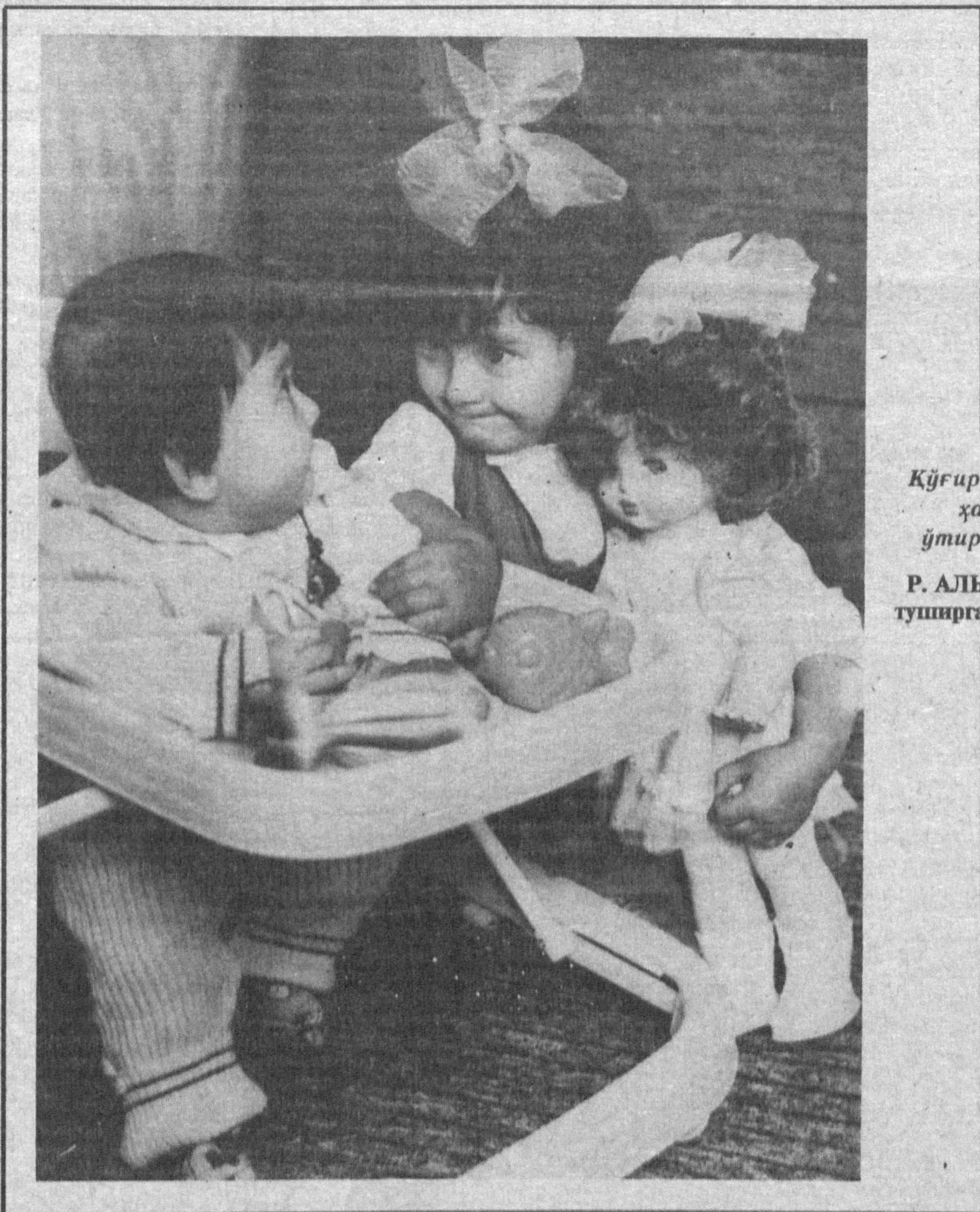
Кўғирчоғим ҳам ўтирсин...