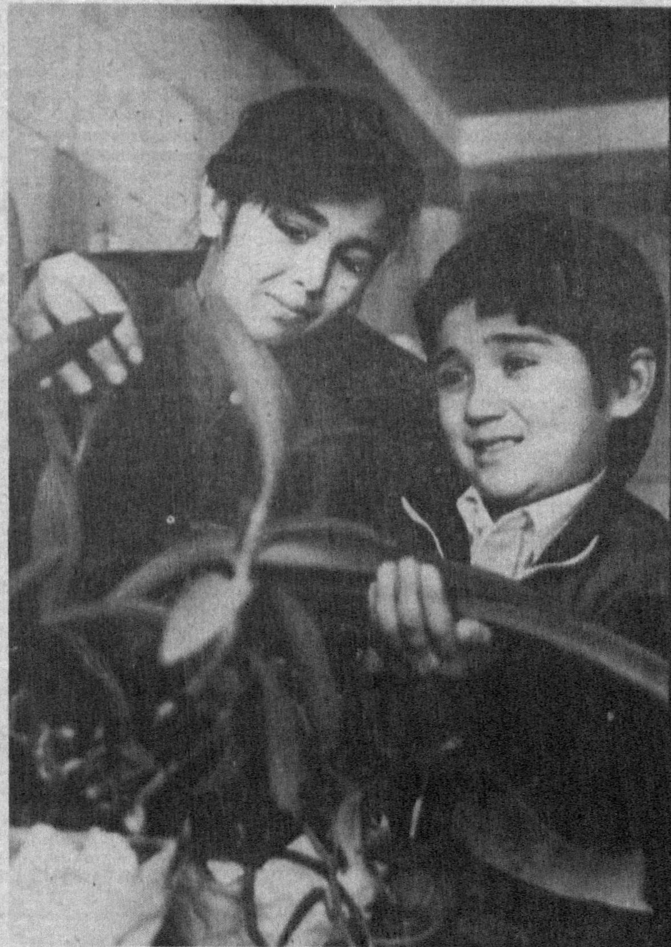
Мана бу гулни қара-а...

Ўзингиз тайёрлаган бундай ширинликлар ҳамда салатлар байрам дастурхонингиздан жой олса, у янада тўкин бўлади.