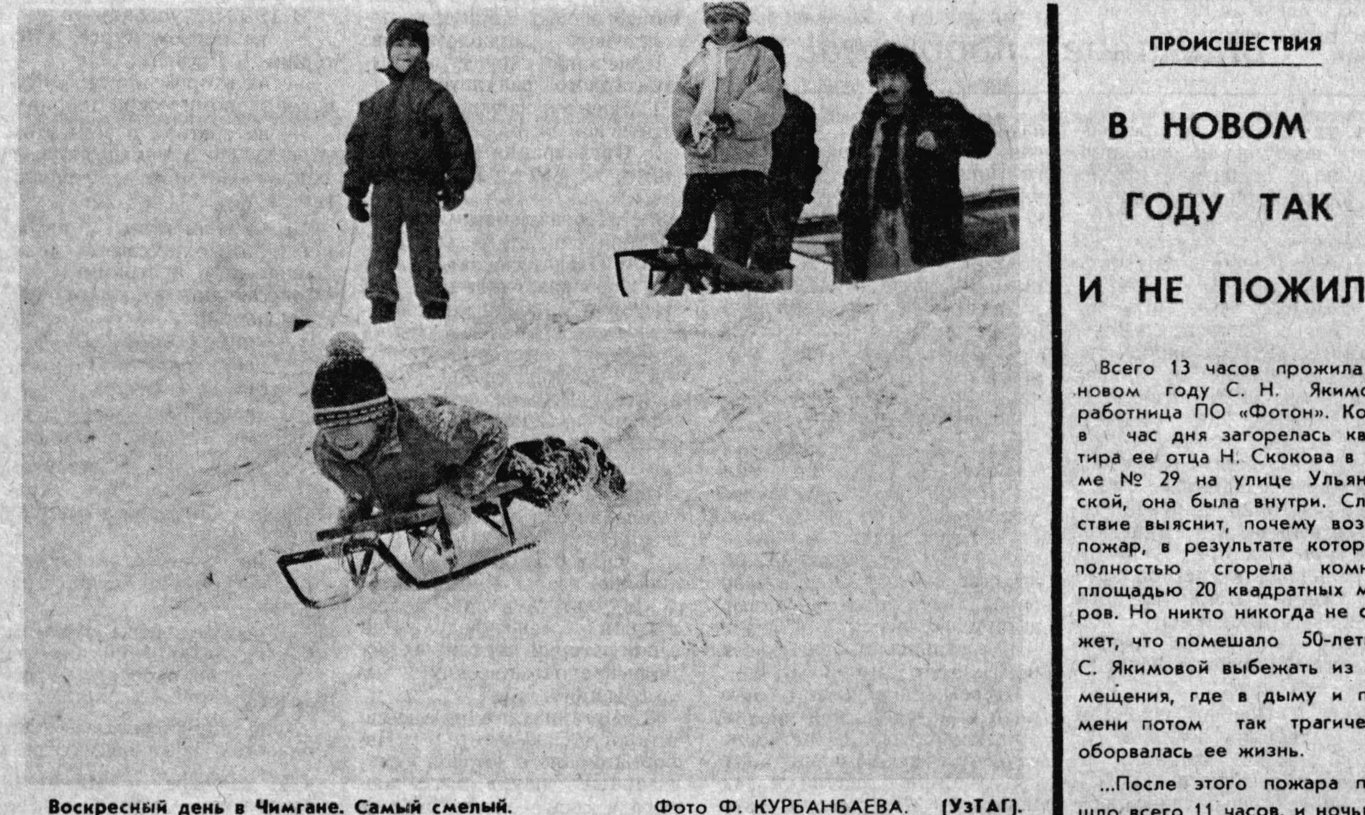
Воскресный день в Чингале. Самый смелый.