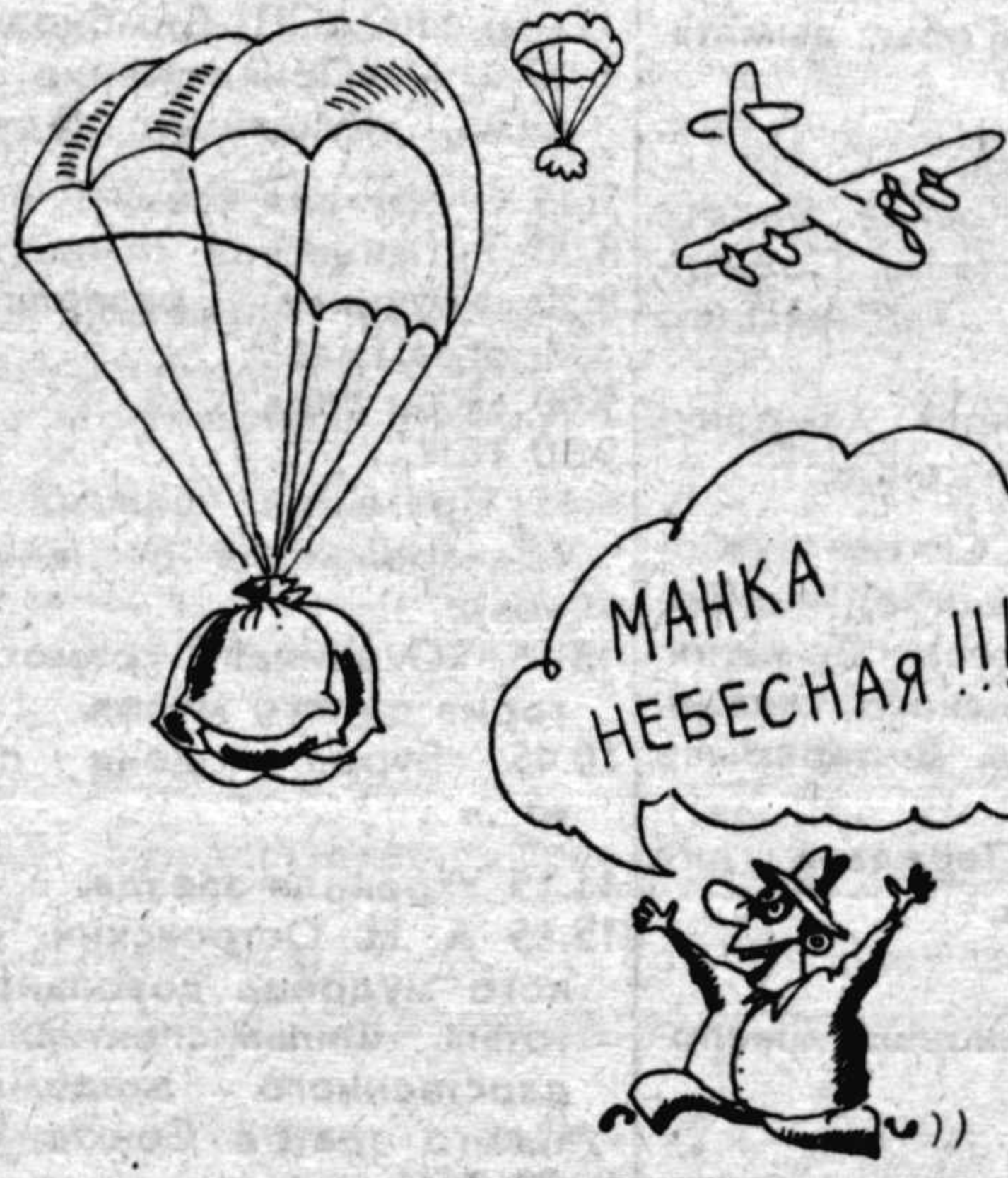
Рис. В. МУРОМЦЕВА.