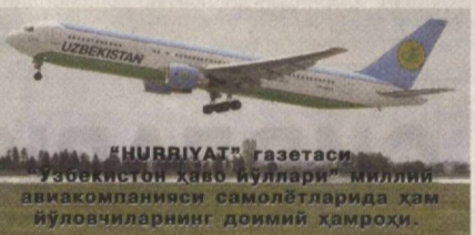
"HURRIYAT" газетаси "Ўзбекистон ҳаво йуллари" миллий авиакомпанияси самолётларида ҳам йўловчиларнинг доимий ҳамроҳи.

Ватанимиз мустақиллигининг йигирма беш йиллиги муносабати билан жойларда «Биз — буюк юрт фарзандларимиз» шиори остида ёшлар фестивали ўтказилмоқда.