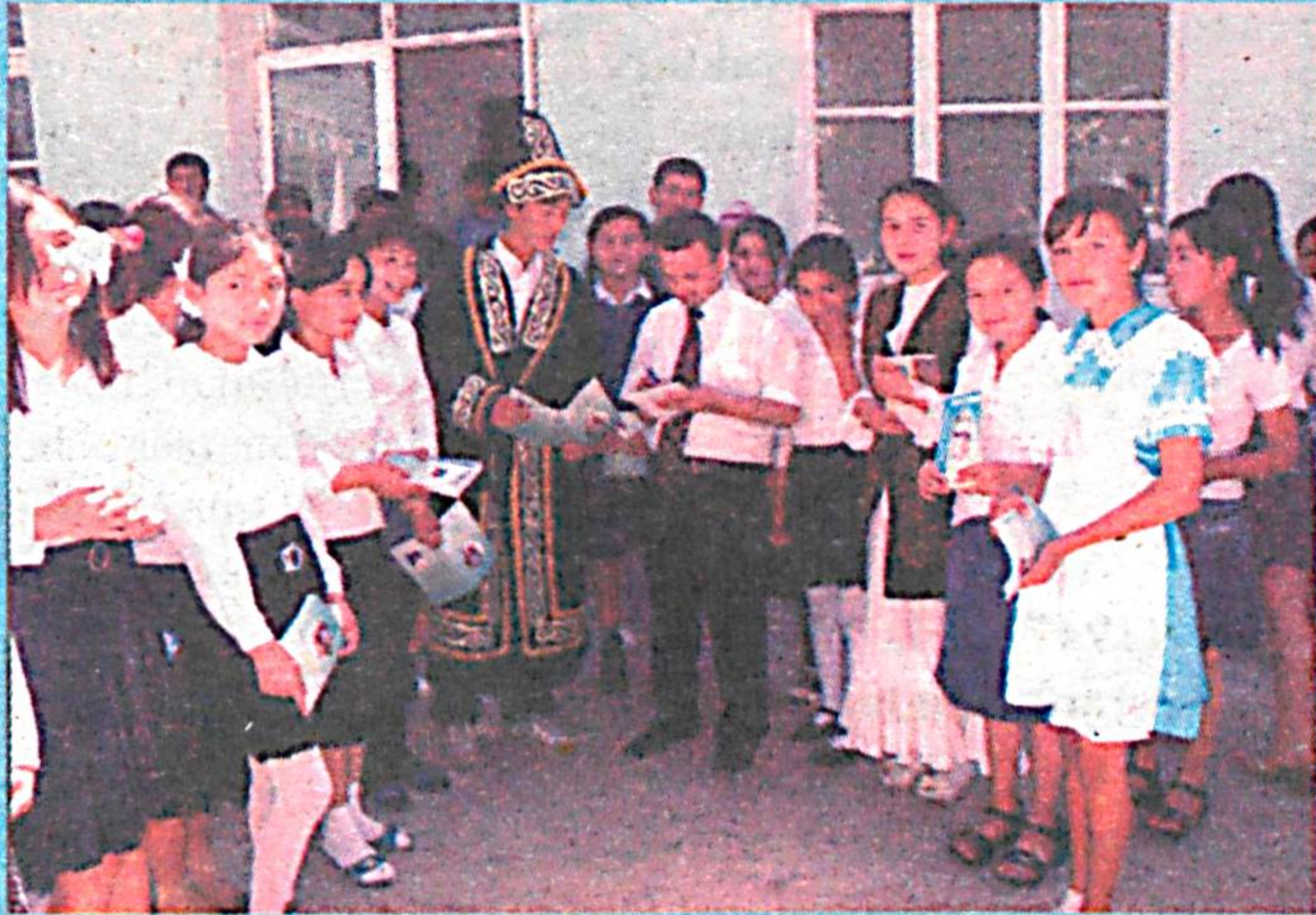
Maktabda bir kun

So'zimizni bejiz do'stlikdan boshlamadik. Biz tashrif buyurgan Yangiyo'l tumanidagi 48-maktabda ikki millat vakillari - o'zbek va qozoq bolalari ahilinoqlikda ta'lim olar ekanlar. Maktabga kirib borar ekanmiz, o'quvchilarning barchasi bir xilda maktab formada ekanligi e'tiborimizni tortdi. Ular nafaqat o'z kiyimlariga, balki o'quv dargohlarining saranjom-sarishta