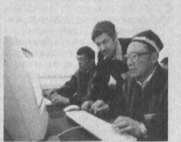
Иштихонлик мактаб ўқувчилари бугунги кунда 17 та замонавий, 74 та мослаштирилган биноларда таълим олишаёпти.

— Иштихонлик мактаб ўқувчилари бугунги кунда 17 та замонавий, 74 та мослаштирилган биноларда таълим олишаёпти.