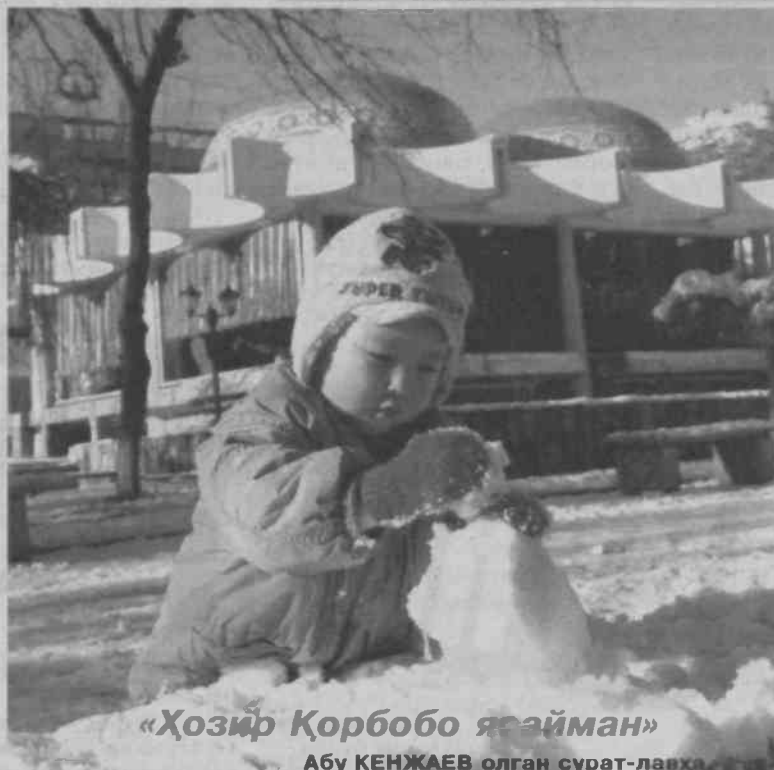
«Ҳозир Қорбобо ясайман»