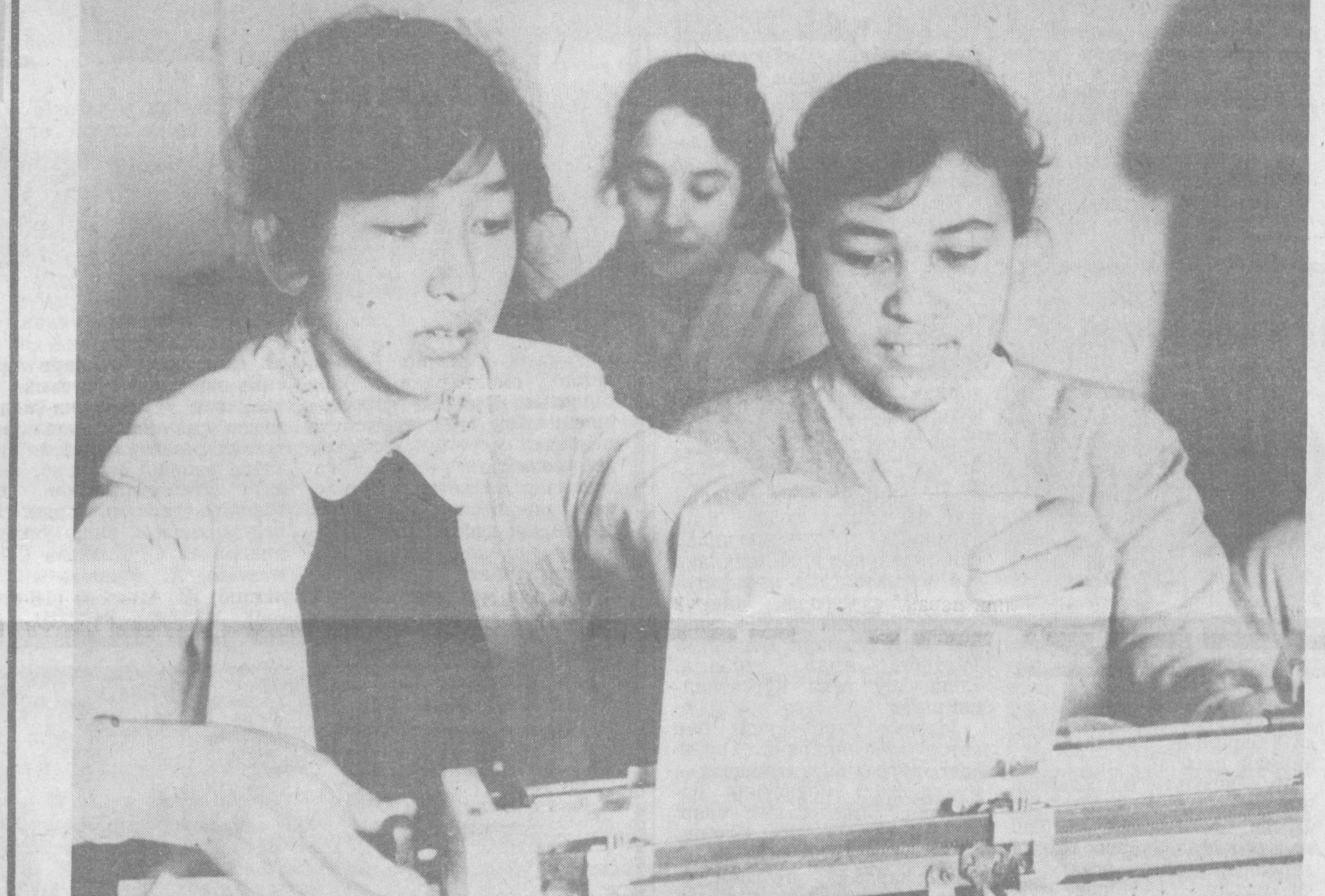
Марҳамат шаҳридаги кашпофлар уйда эски ўзбек алифбосини, ёзув машинаси билан ишлашни ўргатаётган тўғрақлар доний равизида фаолият кўрсатишти.