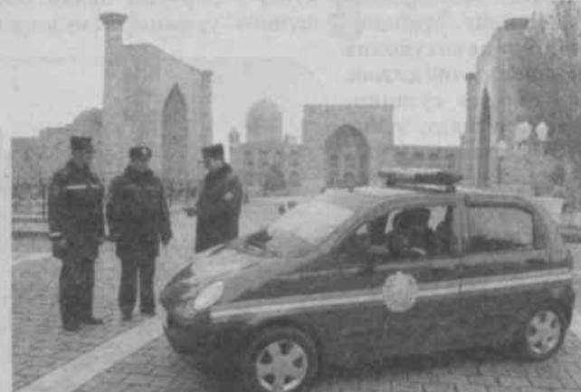
Суратда: патруль-пост хизматининг фидойи ходимлари хизматда.