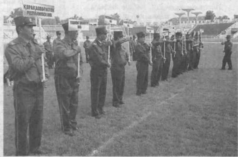
республика ИИБ ППХ ва ЖТСБ бошлиғи ўринбосари, подполковник Ф. Пармановлар иштирок этдилар.

Самарқанд вилояти ИИБ ППХ ва ЖТСБ кинология хизмати питомнигида республика ички ишлар идоралари кинолог ходимлари ўртасида кўпкураш мусобақалари бўлиб ўтмоқда.