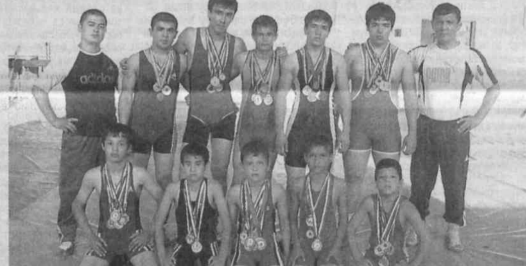
Суратда: республика ҳамда халқаро мусобақаларда фаол иштирок этган бир гуруҳ динамочилар. Муаллиф олган сурат.