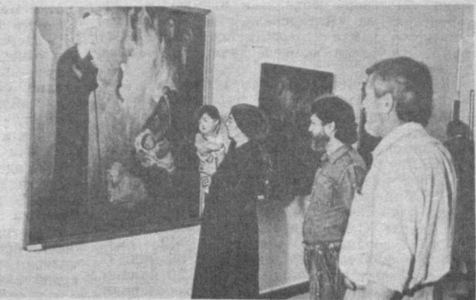
Кунга кеча шеърий мулкнинг султони Алишер Навоий туғилган кунининг 550 йиллиги муносабати билан жумҳурият мусаввирлар уюшмасининг кўргазмалар залида бобокалонимиз ижоди ва ҳаёти ҳақида ҳикоя қилувчи ўзбекистонлик мўйқалам усталари асарлари кўргазмаси очилди. Суратда: маросимдан лавҳалар.