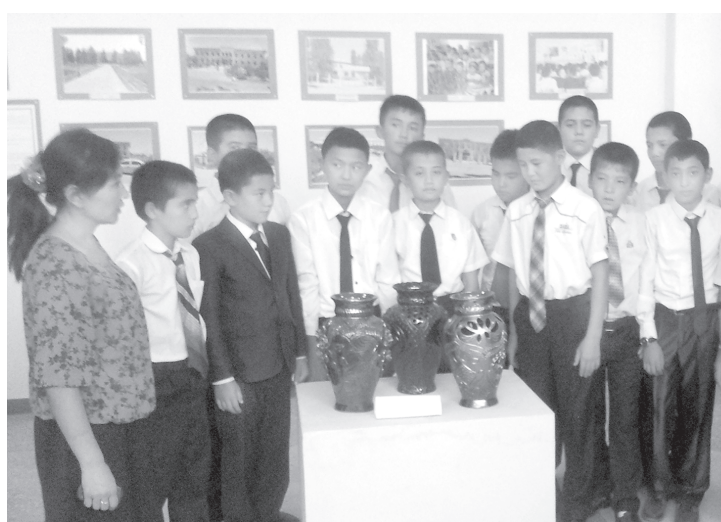
Учащиеся общеобразовательных школ Самарканда в Музее истории культуры народов Узбекистана.

На мероприятии, организованном Министерством по делам культуры и спорта, отмечалось, что в соответствии с постановлением Кабинета Министров «О мерах по обеспечению доступности государственных музеев детям и их родителям» от 11 июля 2014 года в первые дни нового учебного года по всей стране прошла Неделя музеев. В рамках масштабной акции все желающие смогли бесплатно посетить очаги духовности, соприкоснуться с богатым культурным наследием нашего народа. В 39 музеев прошли культурно-просветительские мероприятия, научно-практические семинары и мастер-классы. Были организованы встречи с представителями изобразительного и прикладного