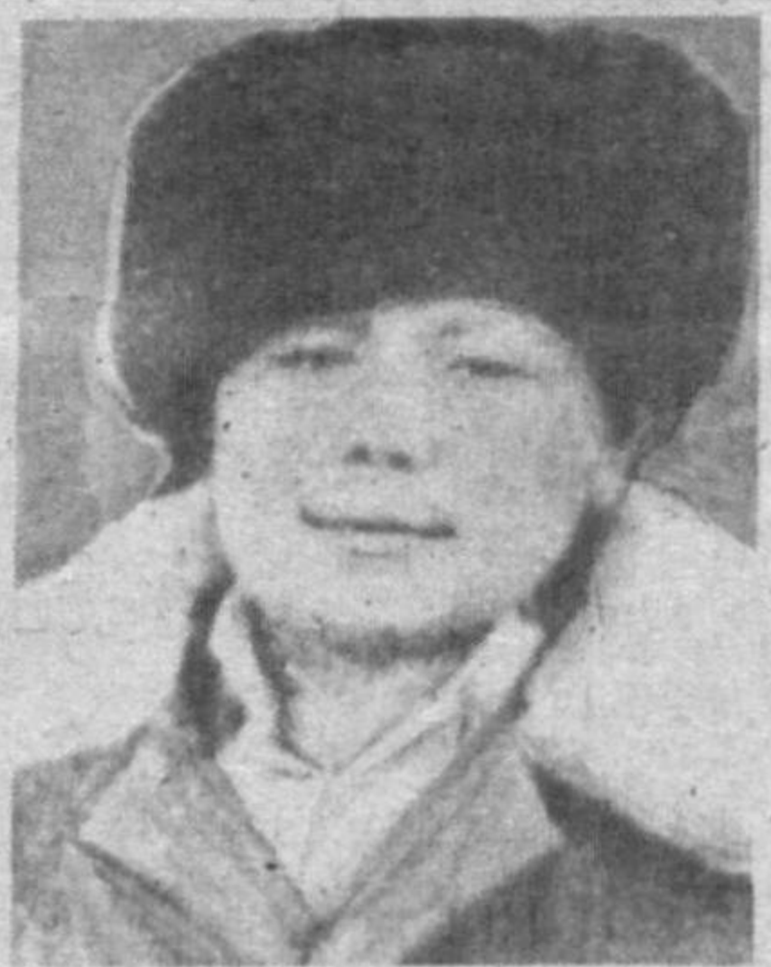
га эга кишилардан бу ҳақда энг яқин милиция бўлимасига хабар беришларини сўраймиз.

Ҳ. Қаландаровнинг қаердалиги ҳақида бирор-бир маълумот-