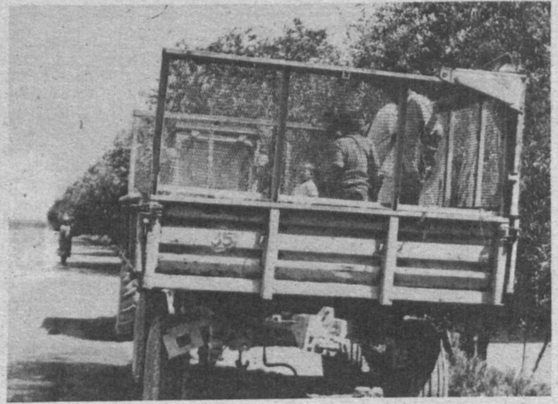
Изоҳнинг ҳожати йўқ.