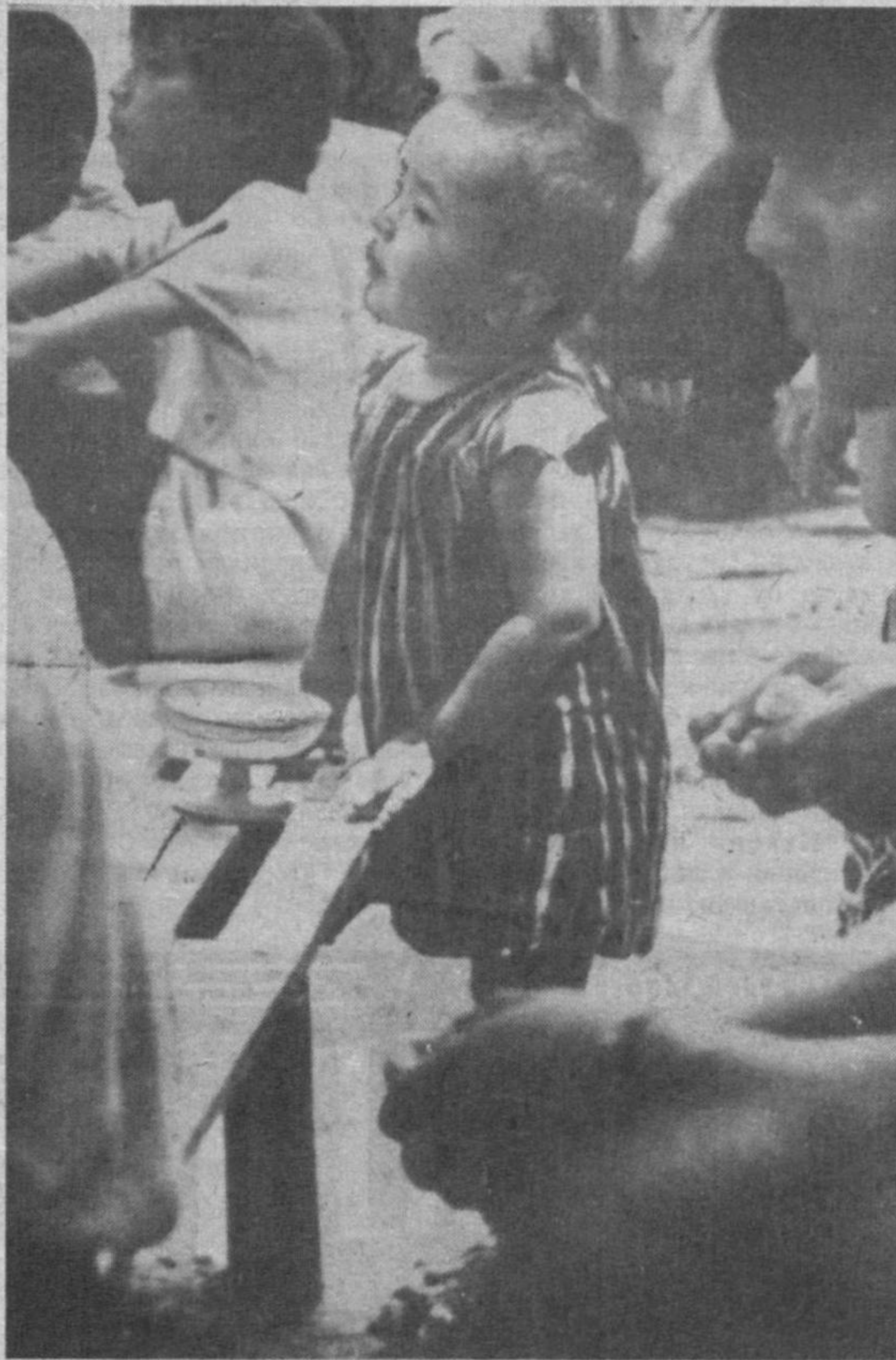
Менга сўз беринг!..