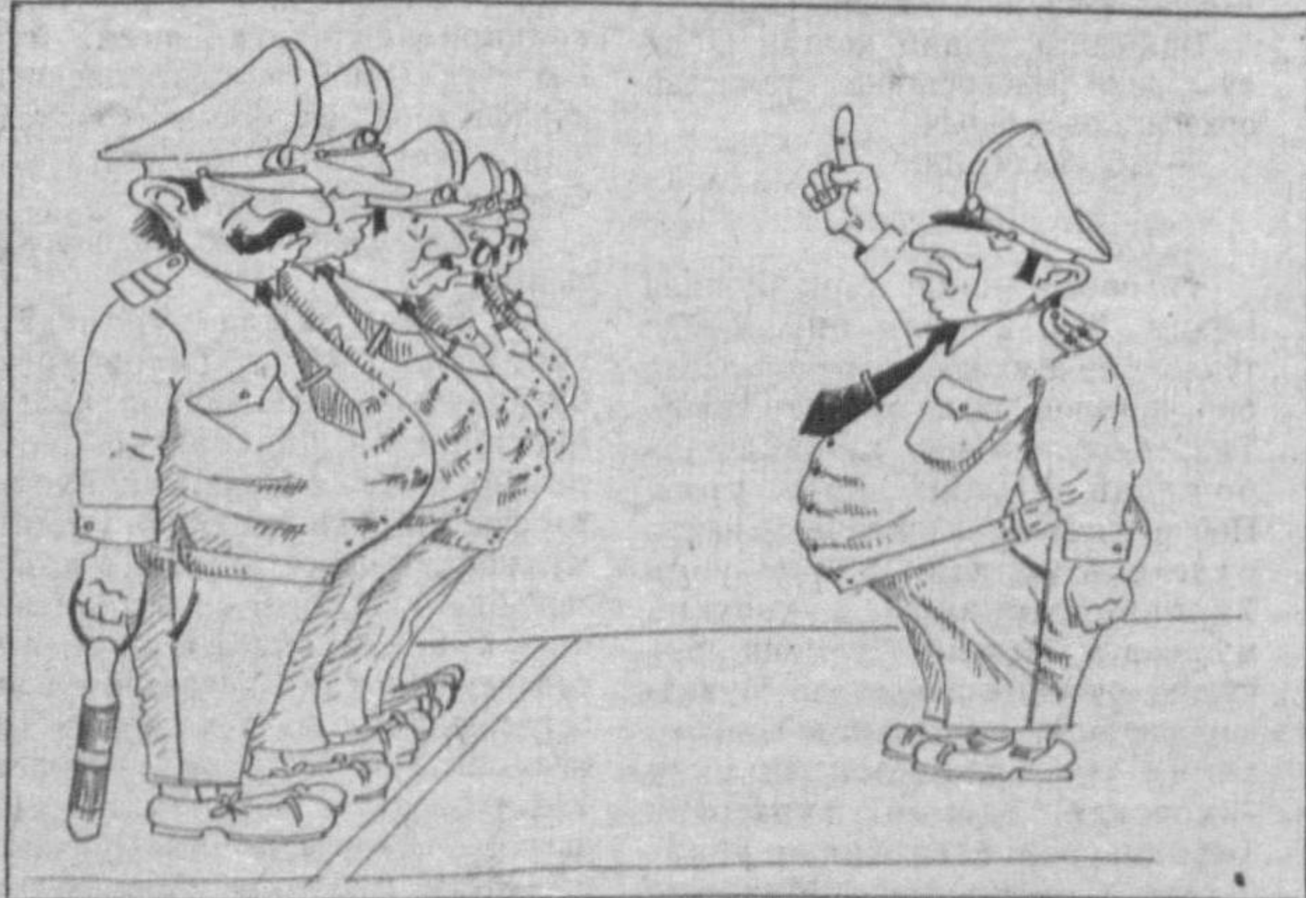
— Эсингизда бўлсин, сизнинг қоматингиз қилчдек бўлиши керак!