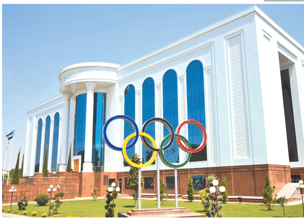
Наши спортсмены уже завоевали 40 олимпийских и паралимпийских лицензий, что является серьезной заявкой к предстоящим играм.

Спустя пару месяцев после открытия гостями нового комплекса стали президент Международного олимпийского комитета Томас Бах и президент Ассоциации национальных олимпийских комитетов и Олимпийского совета Азии Шейх Ахмад аль-Фахад аль-Сабах. Повидавшие за свою жизнь сотни спортивных центров высокопоставленные функционеры здесь были несказанно впечатлены. Глава МОК обошел все пять этажей, подолгу