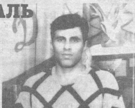
Спорт турлари бўйича эса 120 мамлакат вакиллари ўзаро куч синашдилар.

Шуни таъкидлаш лозимки, дзюдочиларнинг Универсиада турнирида дунёнинг 60дан ортиқ давлатидан спортчилар иштирок этди.