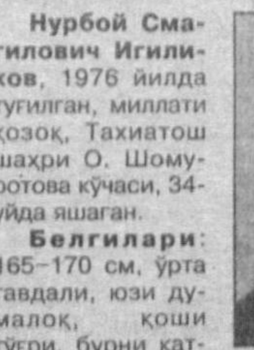
Юқорида номлари зикр этилган шахсларни кўрган ёки қаердалигини билганлардан яқин орадаги милиция бўлимига хабар беришларини сўраймиз.