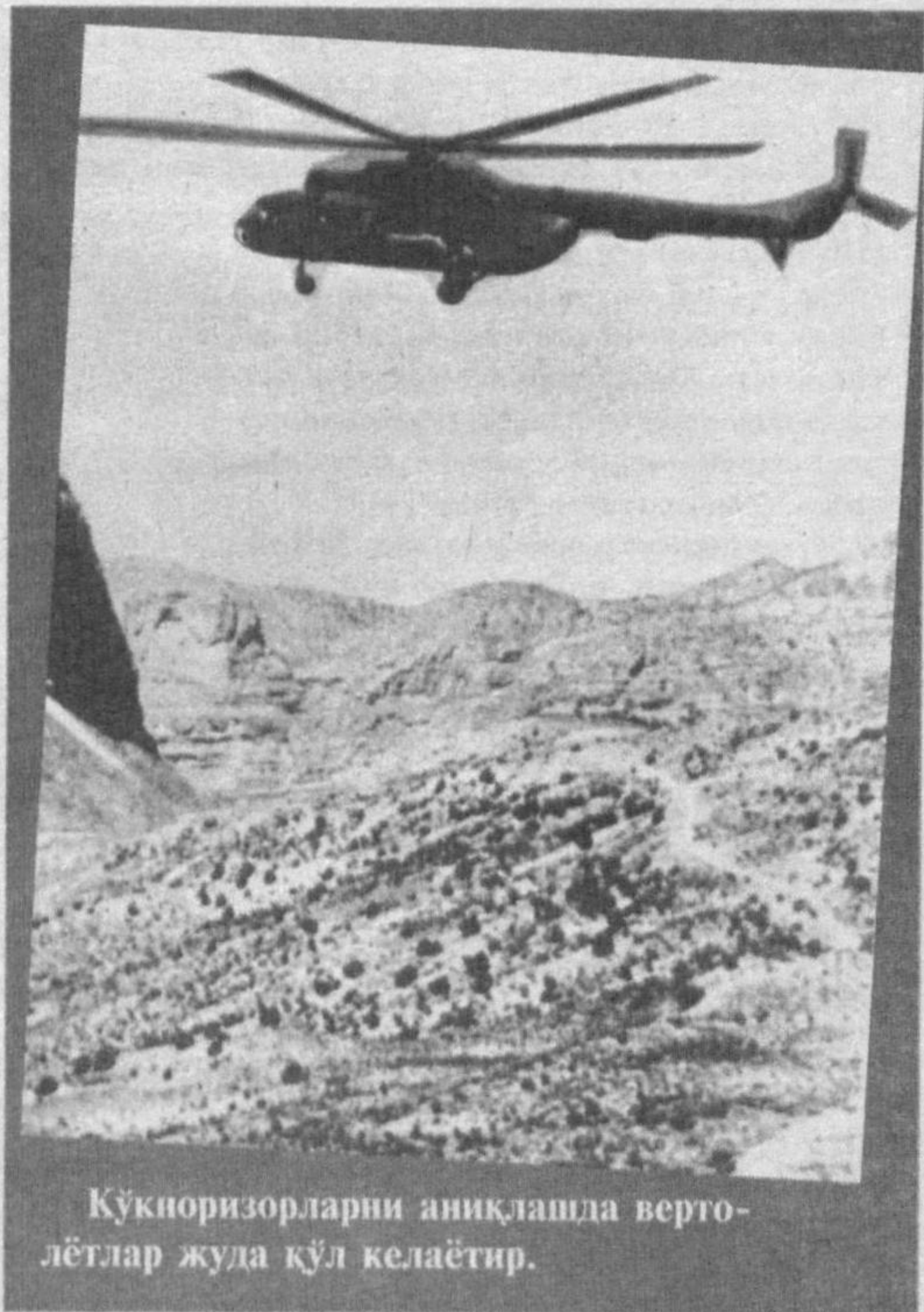
Кўкноризорларни аниқлашда вертолётлар жуда қўл келаёттир.