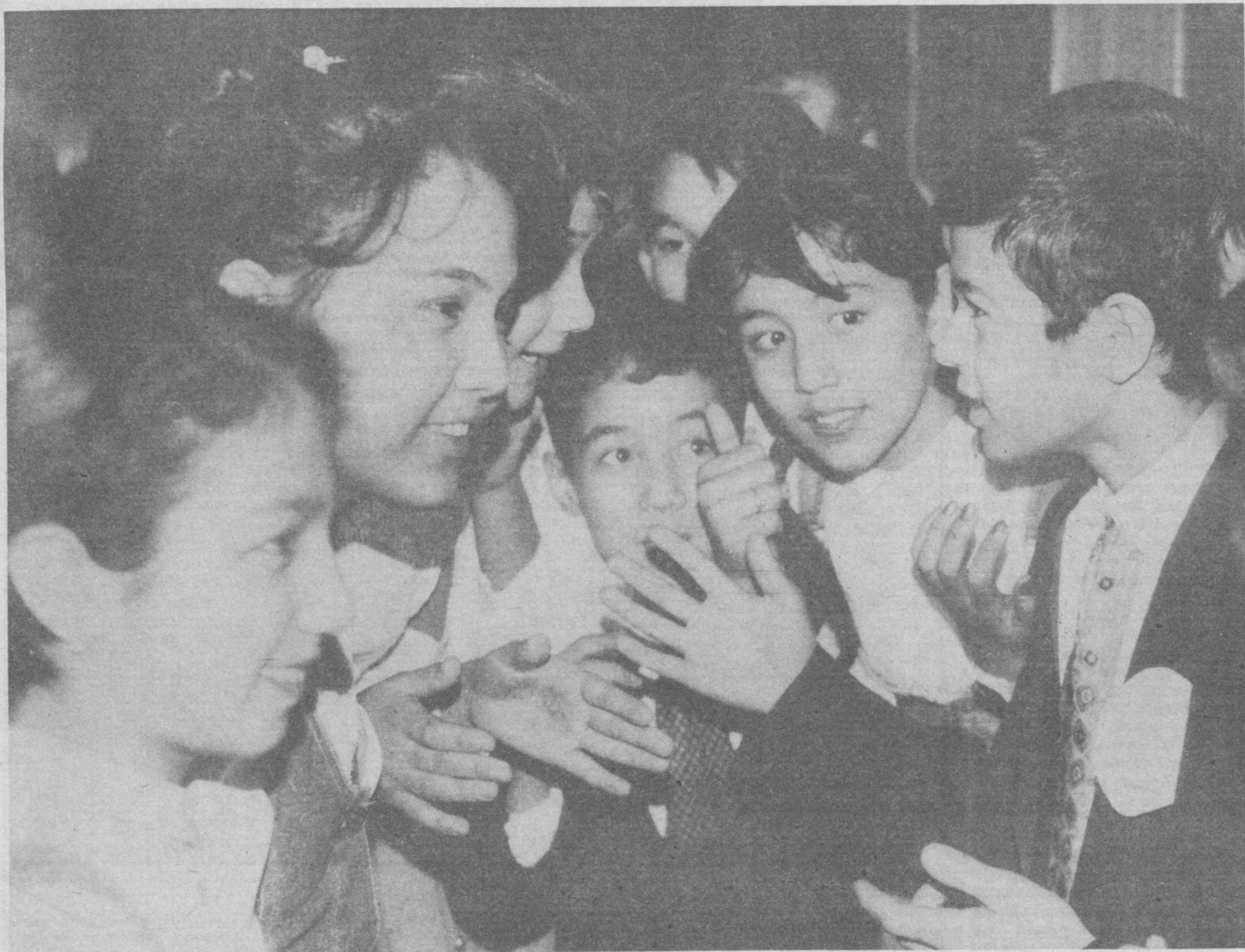
Мустақил фикр баҳсларда терефлашади

Ўзбекистон Республикаси Президенти Ислоҳ Каримовнинг АҚШ мудофаа вазири Уильям Коэнга Ўзбекистон-Америка муносабатларининг ҳарбий техника соҳасида ҳамда "Тинчлик йўлида ҳамкорлик" дастури доирасида ривожланиши ва мустаҳкамланишини қўллаб-қувватлагани учун миннатдорчилик изҳор этилган мактубини мамлакатимиз ташқи ишлар вазири А. Комилов АҚШнинг Ўзбекистондаги Фавқулодда ва Мухтор элчиси Ж. Преселга топширди.