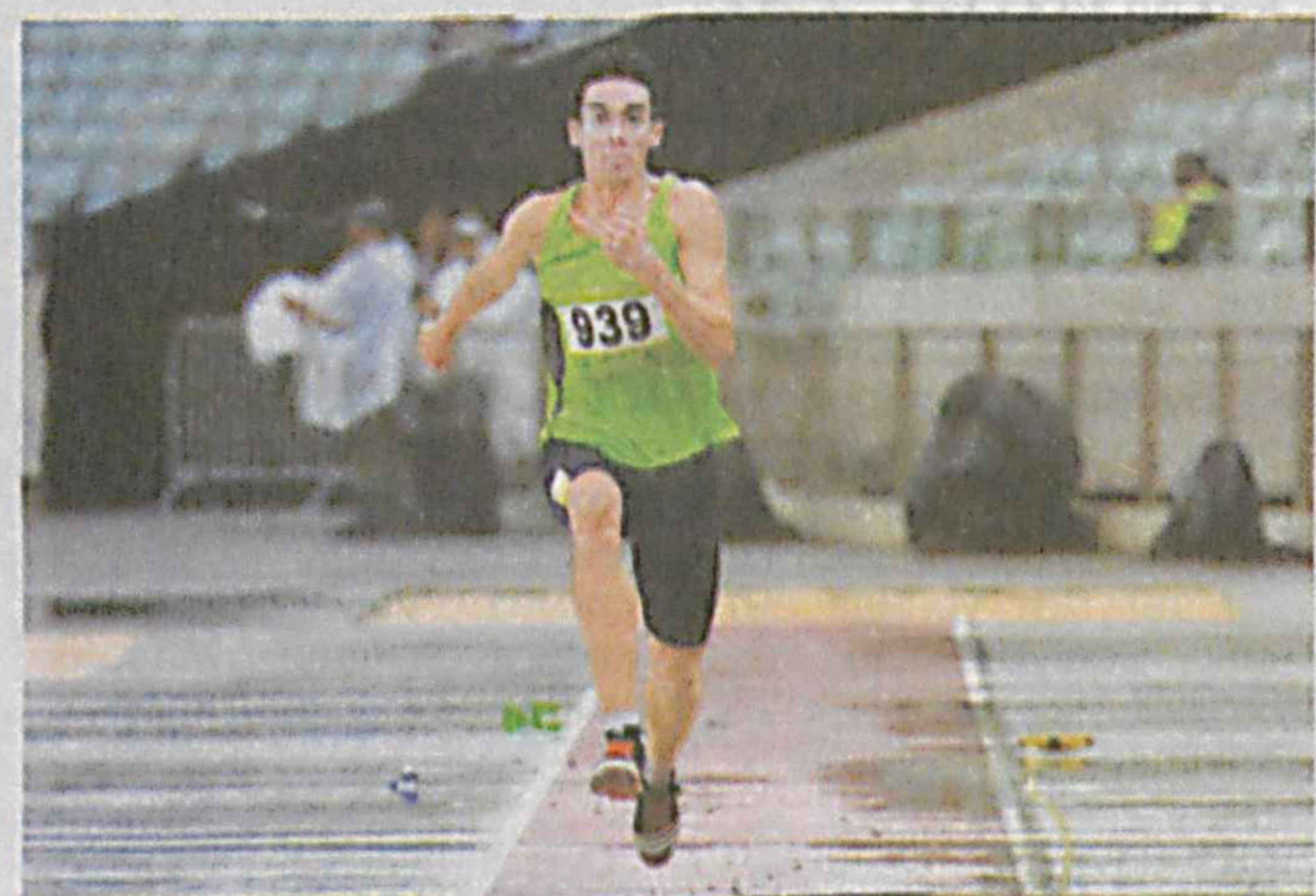
Кеча Буюк Британия пойтахти Лондон шаҳрида пара-атлетика буйича жаҳон чемпионати бошланди.

Нуфузли мусобақада 1300 нафарга яқин спортчилар 213 та медаллар жалмаси учун ўзаро беллашмоқда.