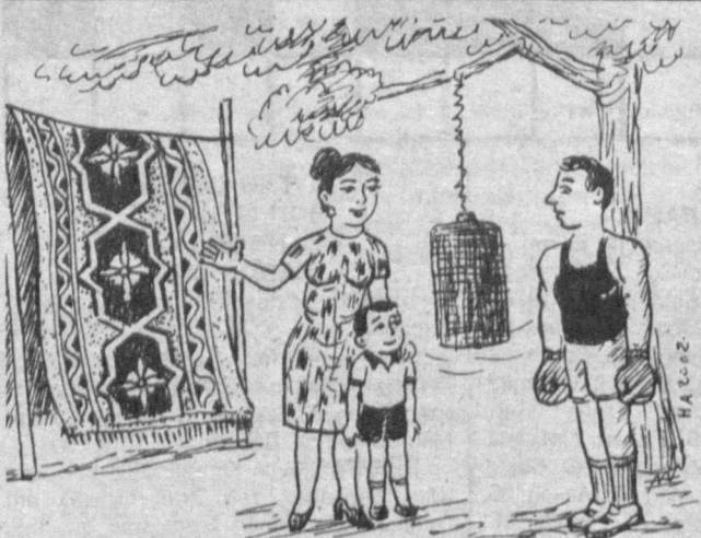
— Дадаси, шу гиламнинг чангини ҳам бир қоқиб берсангиз-чи.