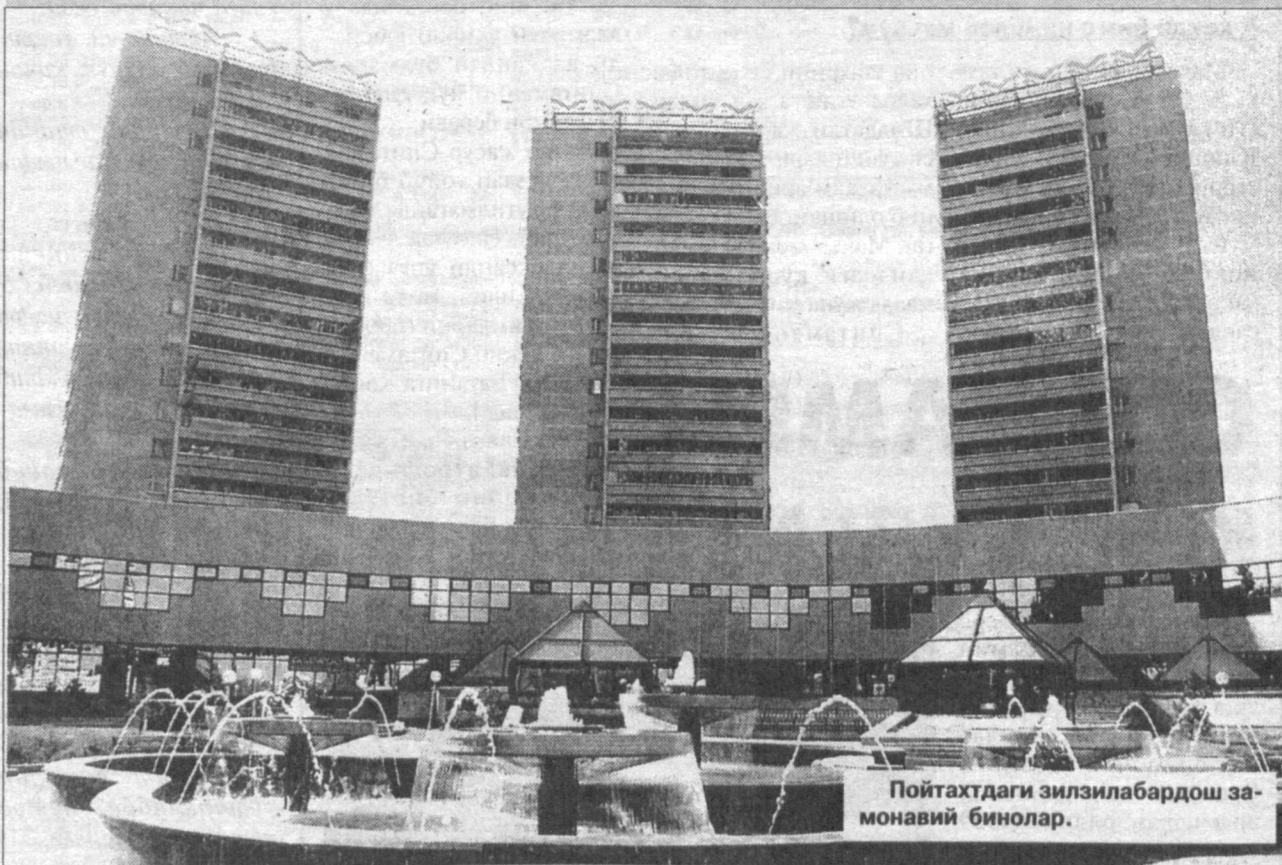
Пойтахтдаги зилзилабардош замонавий бинолар.

— Зилзила ер қаъридаги тектоник ҳаракатлар натижасида рўй беради, — деди Собит Ҳамидович. — Жаҳон олимларининг кўп йиллик изланишлари натижасида ер юзининг сейсмик харитаси тузилган. Харита бўйича сейсмик фаол ва сейсмик жиҳатдан сўнган ҳудудлар белгиланган. Шу ўринда бизнинг республикамиз айнан биринчи тоифага киришини айтиб ўтиш жоиз.