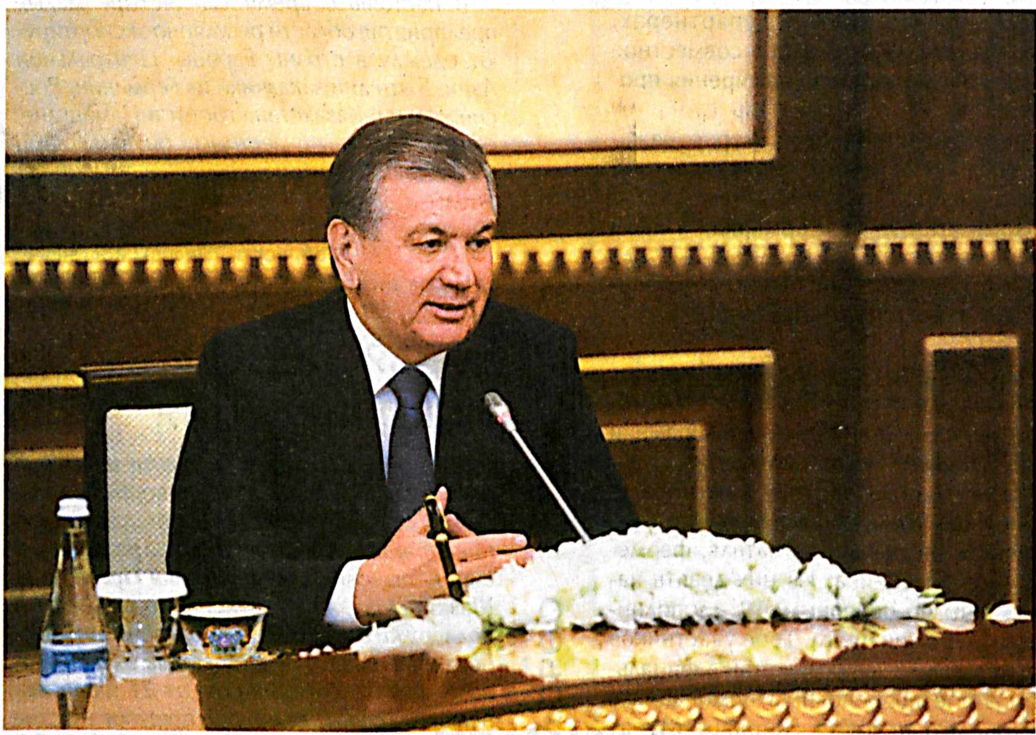
Президент Республики Узбекистан Шавкат Мирзиёев 26 июля принял министра национальной обороны Турецкой Республики Нуреттина Джаникли, находящегося в нашей стране с официальным визитом.

Глава нашего государства, тепло приветствуя гостя, с удовлетворением отметил интенсификацию контактов на различных уровнях и взаимовыгодного сотрудничества между двумя странами.