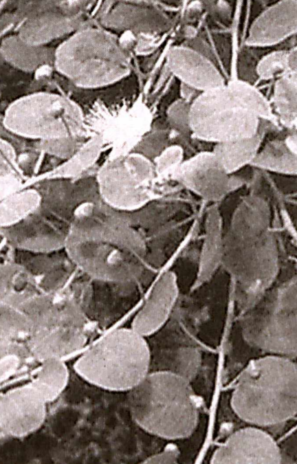
олимплари томонидан унинг "Ўзбекистон-20" нави яратилди. Ковул парвартилаш учун сугориладиган ер майдонлари талаб қилинмайдими, боз устига, агротехникаси ҳам мураккаб эмас.

Гап шундаки, ўсимликнинг илдиз қисмидан олиннадиган дахлама гепатитга шифо бўлса, пояси ва барги тери касалликларидан фориғ бўлишда асқатади, меваси таркибидеги йод буқоқдан азият чекадиган инсонларга катта наф келтиради. Жаҳон фармацевтика санаетида мазкур тавсиялар асосида дорилар тайёрлаш кенг йўлга қўйилгани қувонарлидир.