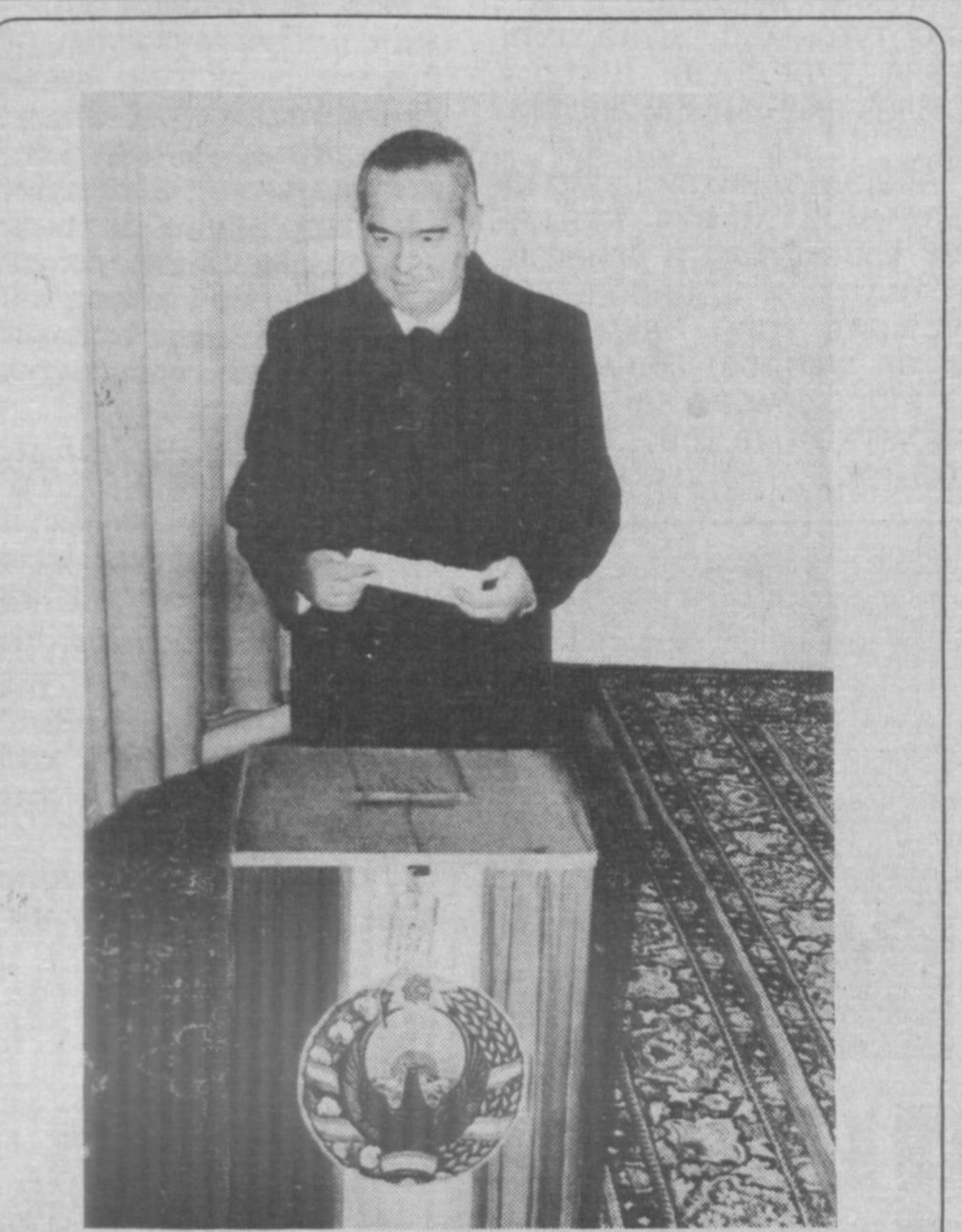
Суратда: Ислон КАРИМОВ Ўзбекистон Республикаси Президенти сайловда овоз бермоқда.

Матбуот анжуманида ҳарбий қисмлар ва шифохоналардаги сайлов участкаларида овоз бериш жараёни ниҳоятгина етгани маълум қилинди.