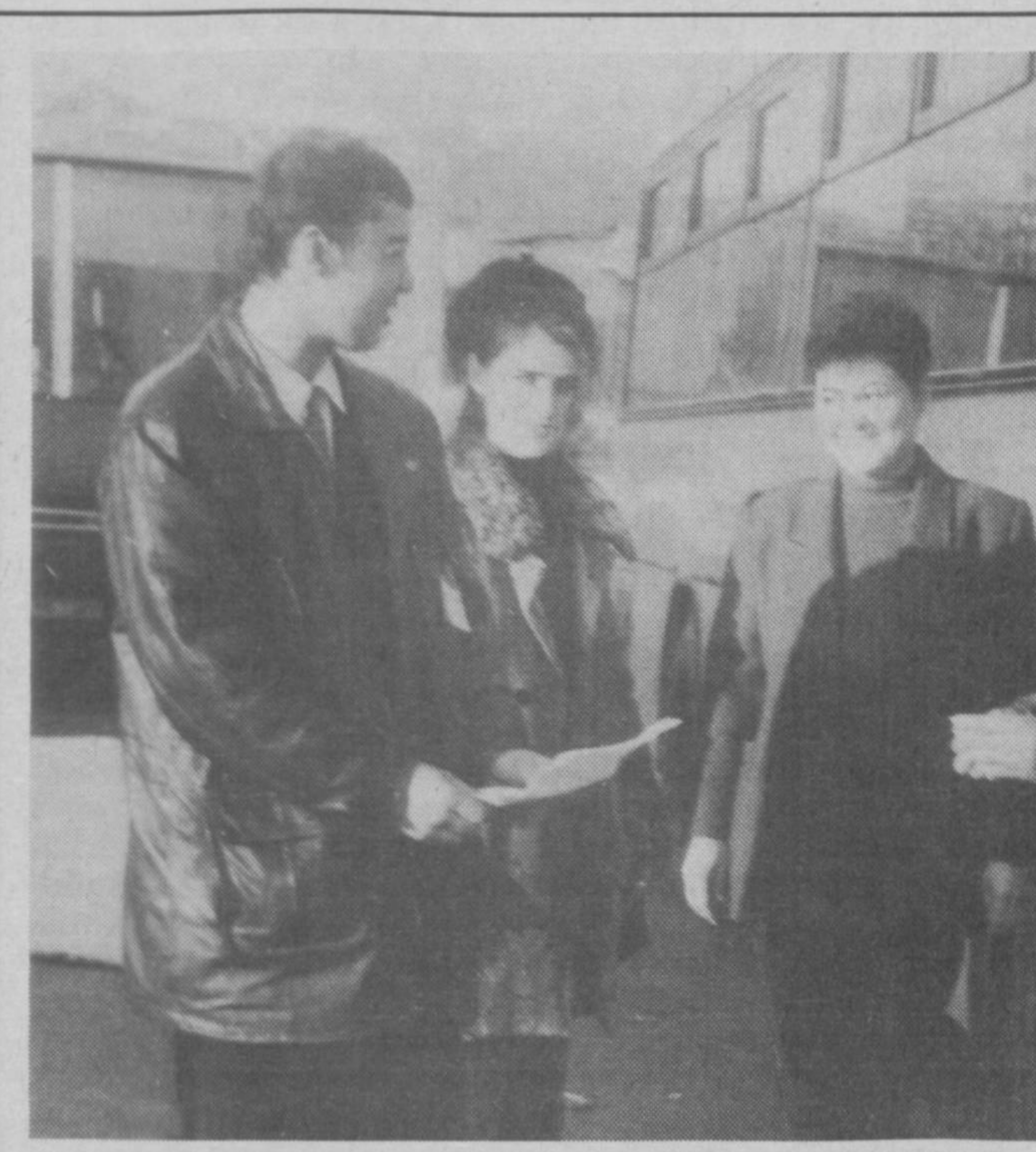
Тошкент шаҳридаги «Самарқанд» шох автобекетини билмайдиган йўловчилар, ҳайдовчилар бўлмас керак. Бу жойни таъбир жониз бўлса «отасон» бекатлардан бири дейиш мумкин. Бу маскан 1932 йилдан бери одамларнинг узогини яқин қилиб келмоқда. Бекат теварак-атрофлари ободлаштирилган, сутуриб-сидирилган. Эрта-ю кеч

Савобли иш қилганингизда хурсанд бўлсангиз, гуноҳ иш қилганингизда эса хафа бўлсангиз, демек, сиз ҳақиқий мўминдирсиз.